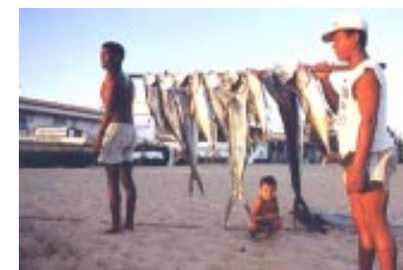
Programa visa aumentar oferta de peixes

Um milhão de pescadores artesanais, responsáveis pela metade da produção de pescado do Brasil, terão muito mais condições de trabalho e de sobrevivência e o consumo de proteínas anual por pessoa via con-