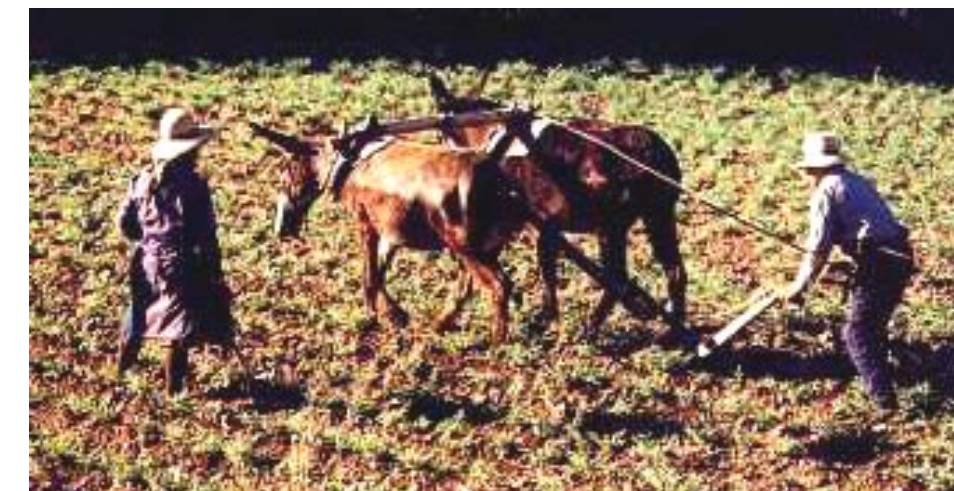
Agricultura familiar é a responsável por colocar comida na mesa da maior parte da população

De cada dez trabalhadores na agricultura, oito estão em atividades familiares. Quase 40% da produção camponesa - o PIB rural - vêm da agricultura familiar. Isto vai aumentar a produção, pois as medidas elevam de 970 mil para 1,4 milhão o número de contratos do Programa