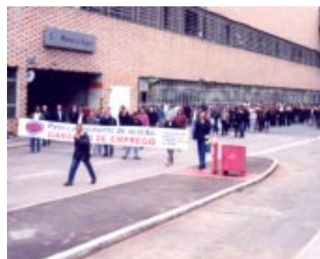
680 carros deixaram de ser produzidos

A Comissão de Fábrica avalia que 680 carros deixaram de ser produzidos. "A partir de agora nossas manifestações serão realizadas nos setores produtivos", avisou Helio Honorato, o Helinho, coordenador da Comissão de Fábrica.