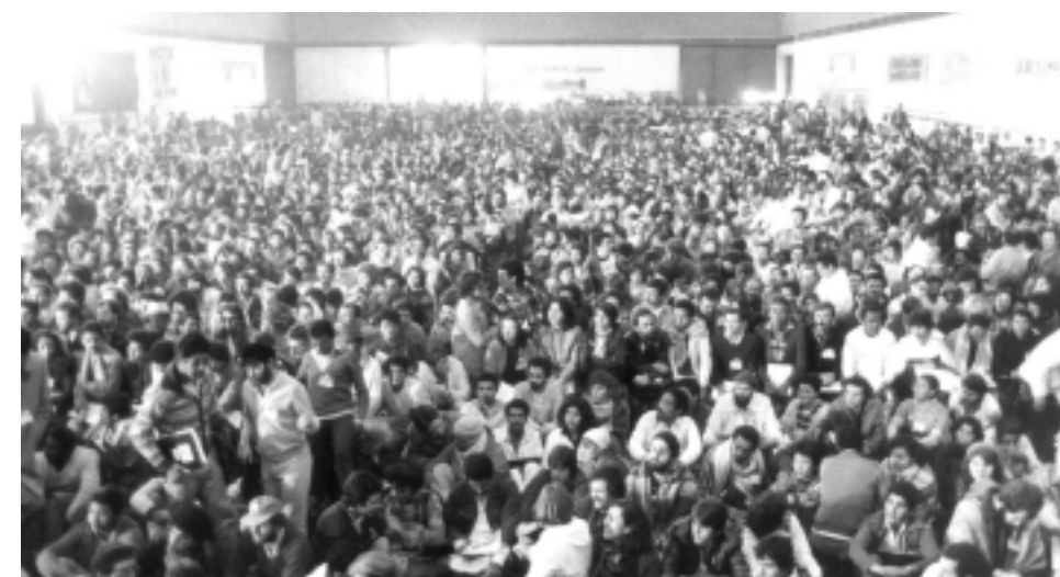
Em 1983, os trabalhadores fundaram a CUT no mesmo pavilhão Vera Cruz

O ato acontece no dia 28 de agosto, no Vera Cruz, com solenidade de posse da diretoria executiva eleita no 8º Concut, e homenagem aos ex-presidentes da Central.