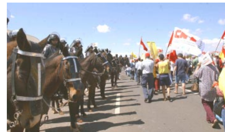
Manifestantes percorrem a Esplanada dos Ministérios em passeata, observados pela polícia

No entanto, a Central reconhece vários avanços no projeto, entre eles, a interrupção do processo de privatização do seguro de acidente do trabalho, o aumento do teto de aposentadoria para os trabalhado-