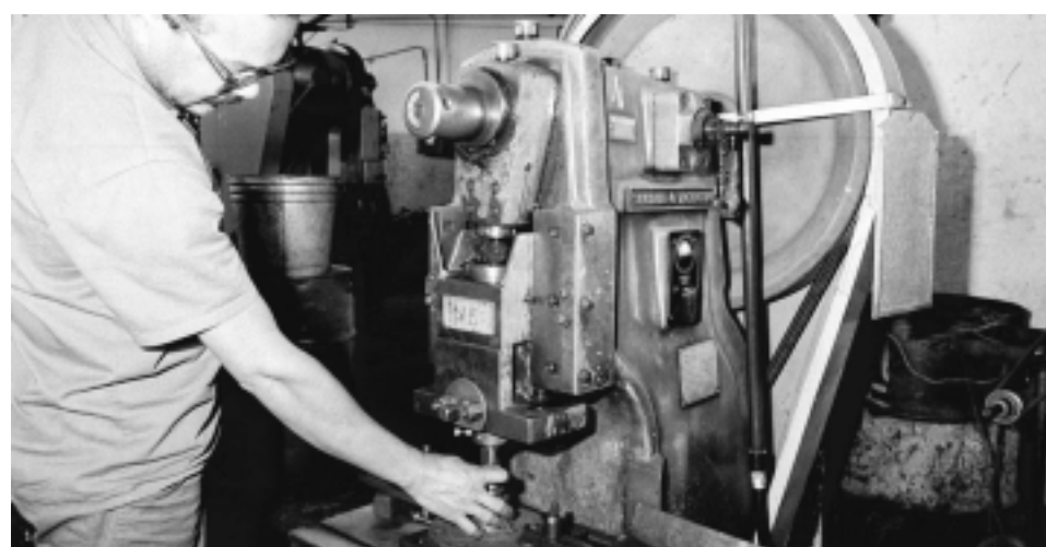
Acordo das prensas garante melhores condições de segurança para os trabalhadores

Baseado neste questionário e na plenária realizada em junho em São Bernardo, a Comissão Permanente de Negociação (CPN) formada por trabalhadores, empresários e DRT, vai encaminhar as medidas