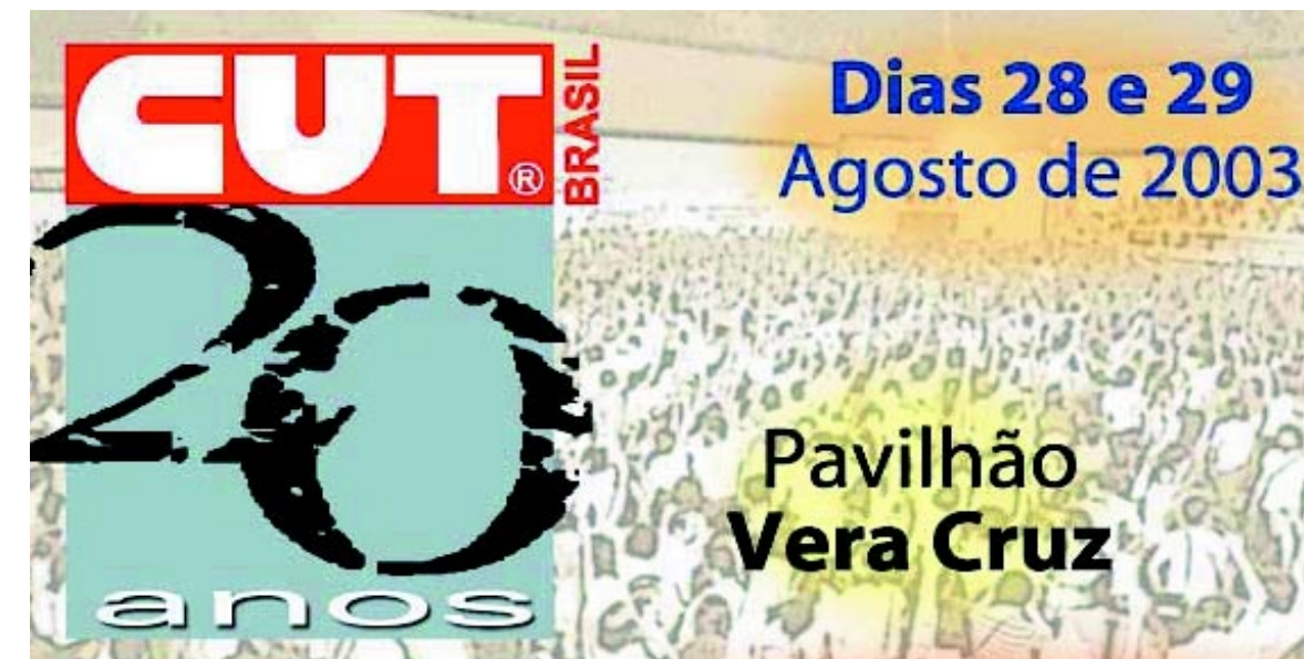
Cartaz comemorativo aos 20 anos da CUT. Leia mais sobre o aniversário da Central na página 2.

Federação exige correção de salário pela inflação passada. Proposta de empresário é o mesmo que arrochar salário. Página 3