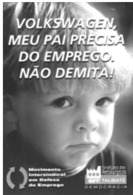
Cartaz dos metalúrgicos pelo emprego