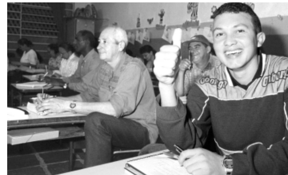
O MOVA busca parcerias para abrir mais salas de aula na região