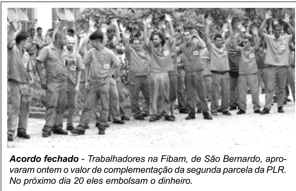
Acordo fechado - Trabalhadores na Fibam, de São Bernardo, aprovaram ontem o valor de complementação da segunda parcela da PLR. No próximo dia 20 eles embolsam o dinheiro.

O diretor ressaltou que a previsão mais otimista poderá ser confirmada com o bom desempenho do mercado interno, uma vez que apenas o crescimento das exportações deverá criar 15 mil postos.