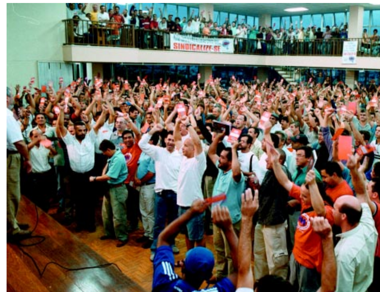
Assembléia que escolheu os delegados ao congresso aprova proposta de reforma