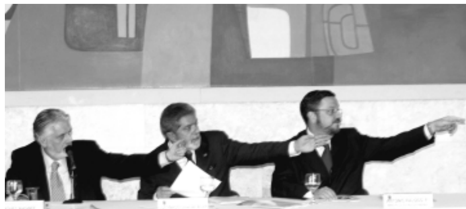
Lula só volta atrás no cancelamento do visto se o jornalista se retratar publicamente

Ela pesquisou as matérias dos últimos 20 anos do jornal america-