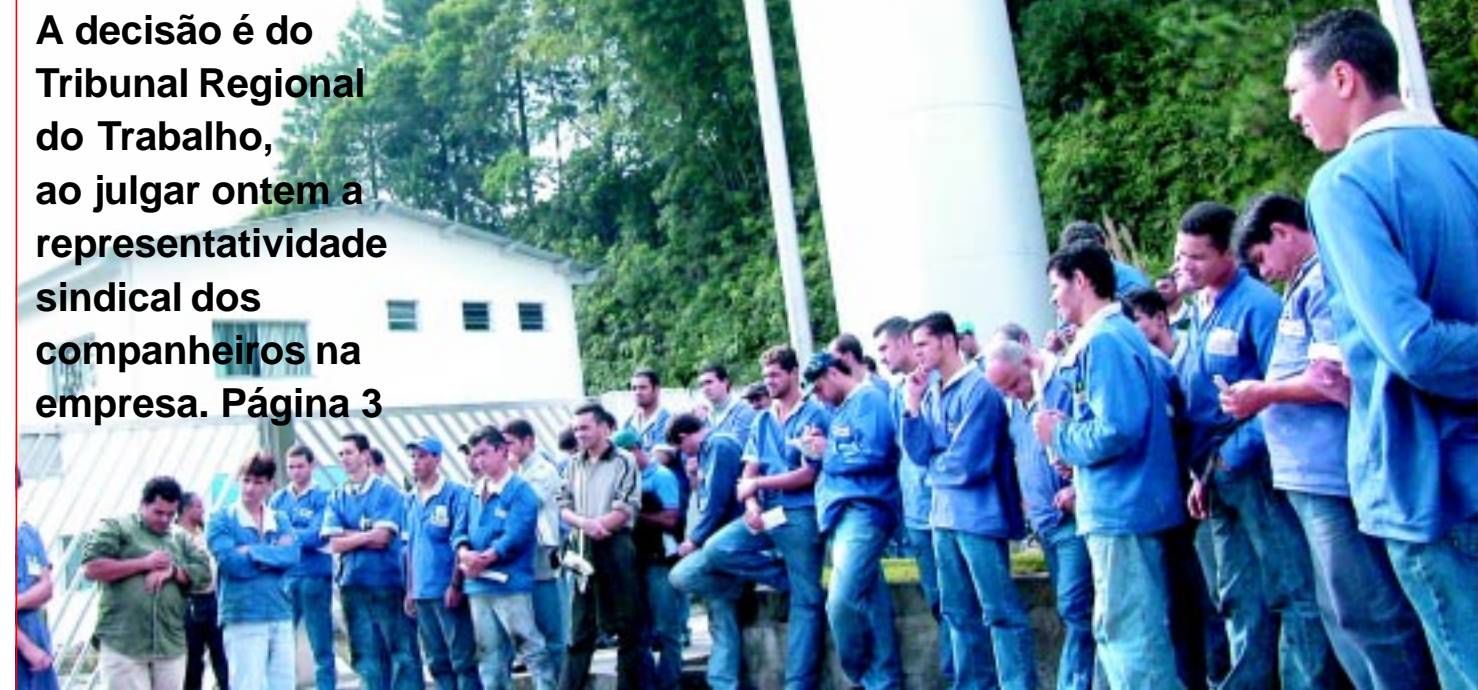
Julgamento foi motivado pela luta da PLR no ano passado

A decisão é do Tribunal Regional do Trabalho, ao julgar ontem a representatividade sindical dos companheiros na empresa. Página 3