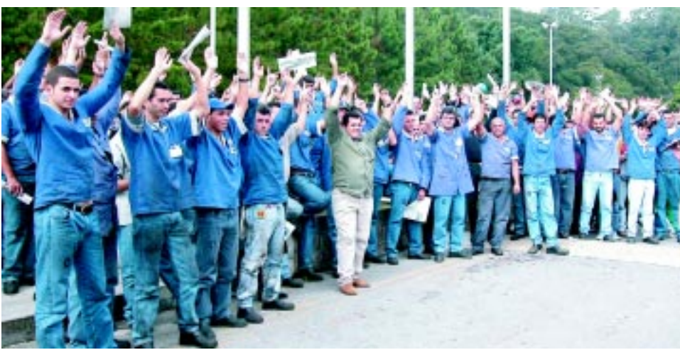
Assembléia que aprovou acordo de PLR do ano passado mas que a empresa não cumpriu

O Sindicato dos Metalúrgicos do ABC é o legítimo representante dos trabalhadores na Inox Tubos, de Ribeirão Pires. Foi essa a decisão do Tribunal Regional do Trabalho (TRT), ao julgar ontem um protesto dos companheiros pela PLR realizado no início deste ano.