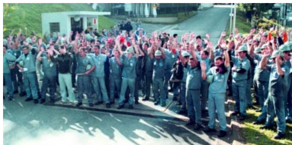
Assembléia do pessoal na Brasmetal aprova a proposta de PLR

O acordo vale por dois anos, com garantia de reajuste pelo índice da reposição da inflação.