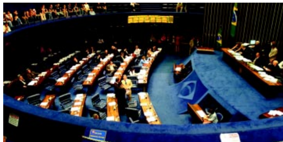
Se o Congresso trabalhar durante o recesso, cada parlamentar embolsará R$ 38.000,00

O adiamento atende os interesses da população na votação dos projetos, contempla o Executivo e não prejudica os parlamentares, que gozariam os mesmos 30 dias de férias e não teriam a imagem prejudicada pela polêmica em torno do tema. Além de economizar R$ 50 milhões.