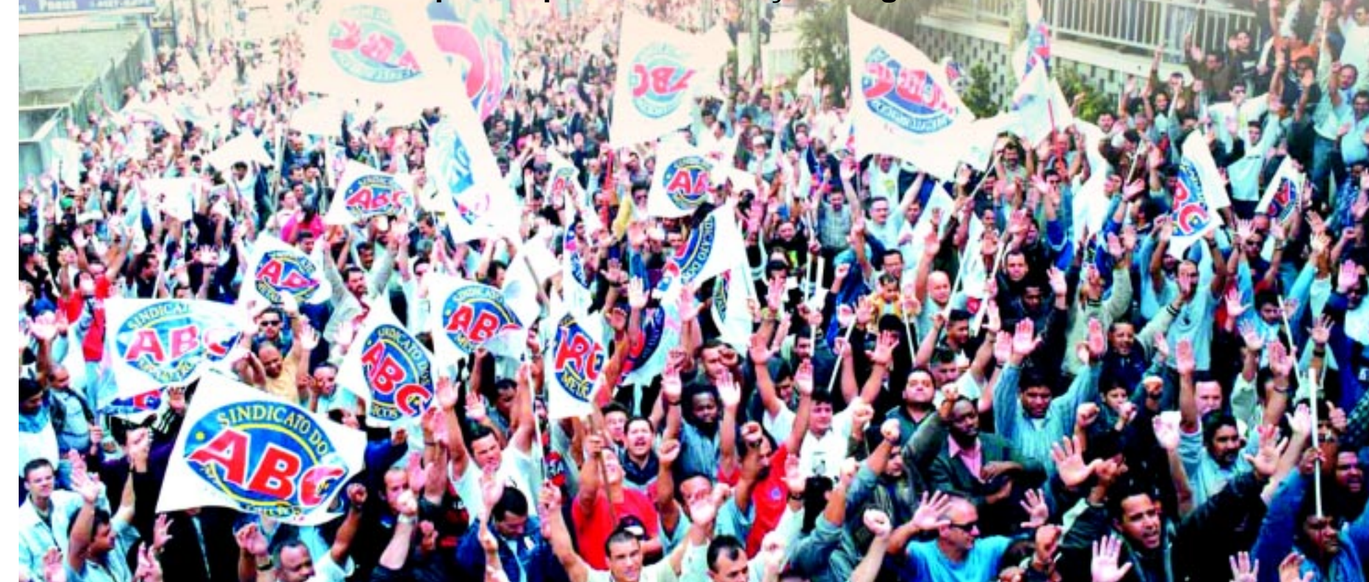
Os metalúrgicos do ABC estão entre as categorias que conseguiram repor perdas e conquistaram aumentos reais nestes 10 anos

A conclusão é de estudo do Dieese que comparou os resultados de 150 campanhas salariais ano-a-ano. A constatação é que nesse período os trabalhadores perderam poder de fogo e metade das categorias não conseguiu repor as perdas da inflação. Página 3.