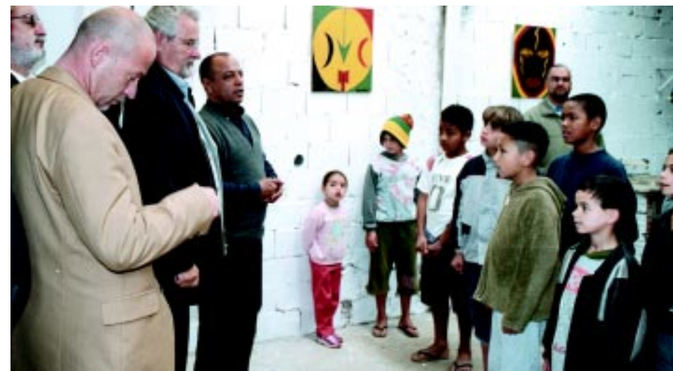
Dirigentes sindicais alemães visitam unidade do Solano Trindade

A ofensiva patronal sofrida pelos trabalhadores na Mercedes-Benz na Alemanha vai se estender às demais fábricas no país, inclusive à Volkswagen. Para piorar, ela acontece em um momento em que o governo, apesar de se dizer de centro-esquerda, adota posições claramente neoliberais e favoráveis aos empresários. O Ig Metall, sindicato dos metalúrgicos alemães, promete reagir, mas a melhor maneira de enfrentar o ataque é formar uma rede mundial de trabalhadores.