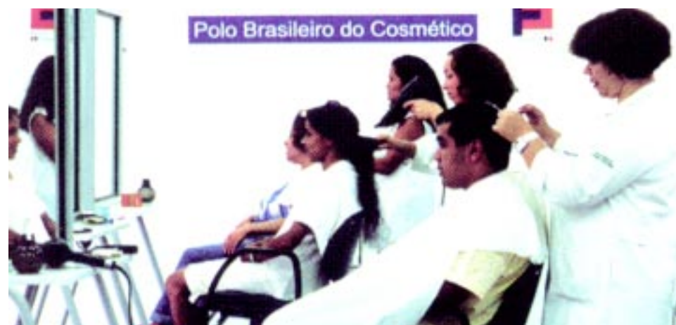
Espaço Beleza, mantido pelo Pólo de Cosméticos, formou 2,5 mil alunos em 40 cursos

O Quarteirão da Saúde reunirá num único espaço diferentes serviços médicos e será o mais completo sistema de urgência e emergência para adultos e crianças do ABC.