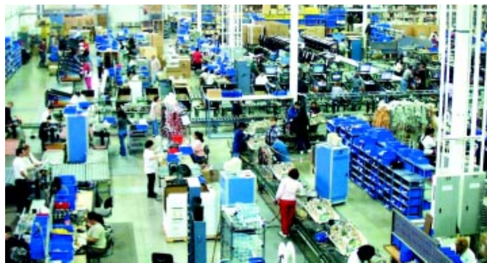
Emprego industrial cresce seis meses seguidos em São Paulo e quatro meses no Brasil