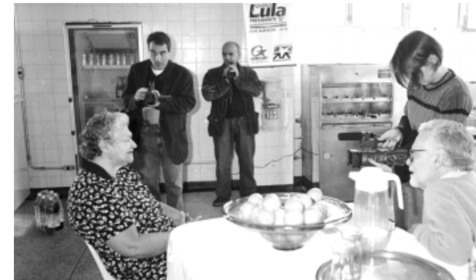
Coutinho e sua equipe entrevistam a Tia do Bar na Sede do Sindicato

As entrevistas trazem ainda muito da vida de seus personagens 20 anos depois e também cenas de manifestações da época.