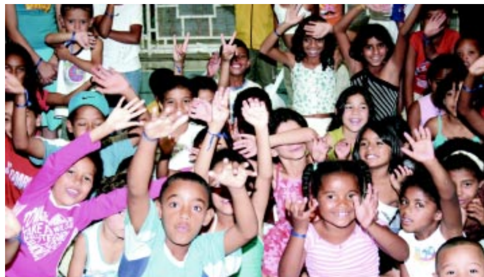
Crianças também ganharam café da manhã, almoço e brincaram na piscina

A festa teve também café da manhã com bolo, pão com manteiga e chocolate quente; almoço com cachorro-quente, pastel, churrasco, sorvete, refrigerante e pipoca. A recreação incluiu diversas brincadeiras, com direito a piscina e ao uso do tobo-água.