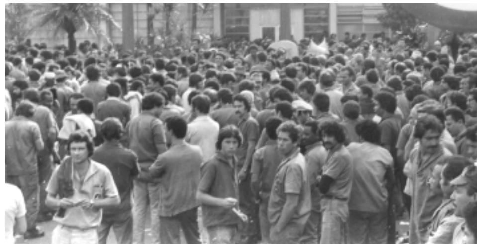
Representação dos trabalhadores foi conquistada depois de três dias de greve

A greve durou três dias e, ao final, todas as reivindicações foram