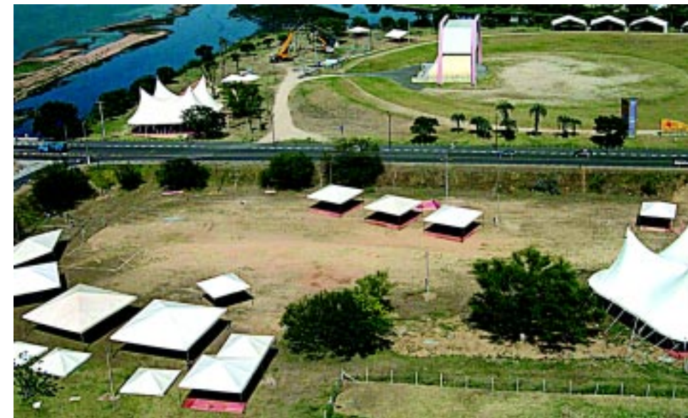
O fórum acontece em tendas instaladas às margens do Rio Guaíba

mil organizações de 112 países em atividades como conferências, painéis, testemunhos, oficinas e seminários.