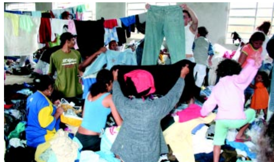
Famílias desabrigadas tentam se organizar na Creche do Centro Padre Léo