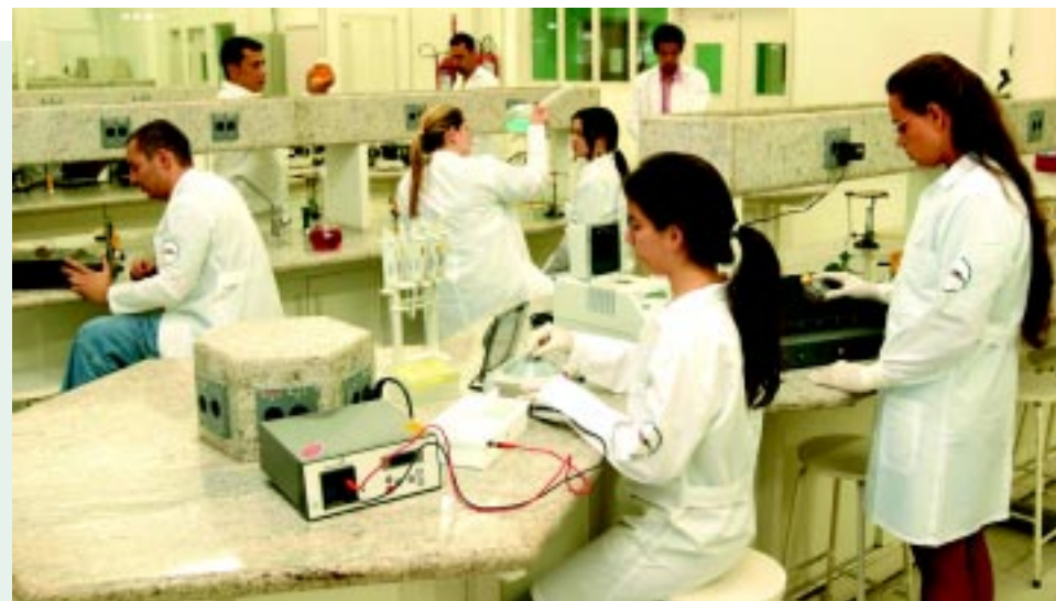
Faculdades como a Uniban oferecem até 30% de desconto

Se você estuda numa dessas faculdades ou passou recentemente no vestibular, saiba que em convênio com o Sindicato elas oferecem descontos de 10% a 30% nas mensalidades e matrículas. Se você ainda não é sócio, aproveite!