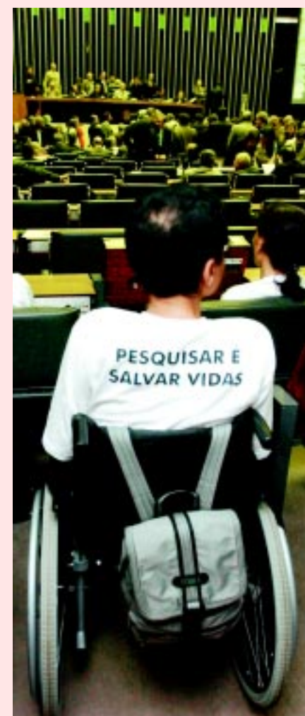
Plenário da Câmara na quarta-feira

A Câmara Federal aprovou na quarta-feira projeto regulamentando o uso de células-tronco para pesquisa e terapia. É a chamada Lei da Biossegurança, que prevê também o plantio de produtos transgênicos.