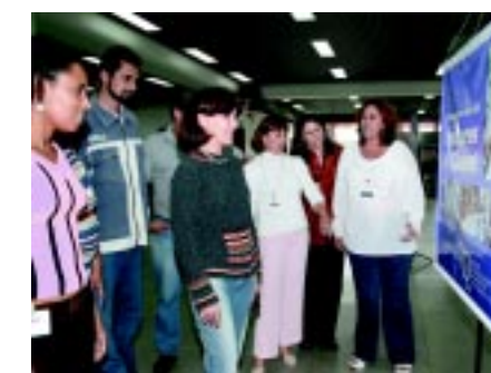
Companheiras visitam exposição das mulheres montada na Mercedes

Amanhã tem sessão de cinema no Sindicato (veja na página 4). No domingo, tem CUT Cidadã, com prestação de serviços à mulher das 9h às 17h. No Sesc Interlagos, Av. Manoel Alves Soares, 1.100, São Paulo.