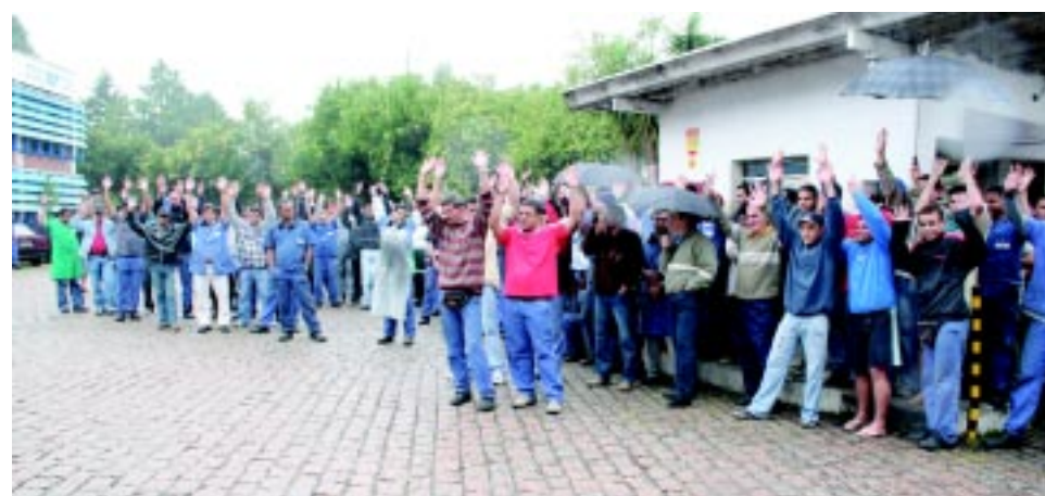
Com a proposta aprovada, pessoal na Proxyon recebe dia 5 a primeira parcela

Ao aprovarem ontem a proposta de PLR negociada com a empresa, os trabalhadores na Proxyon, em São Bernardo, garantiram o acerto da primeira parcela já no dia 5 de maio.