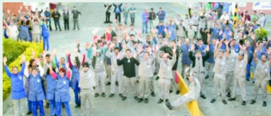
Assembléia de PLR dos companheiros na Asbrasil ontem pela manhã

Na Brasmetal , em Diadema, a companheirada garantiu um bom valor de PLR e também a tarifa zero nas contas onde recebe o salário.