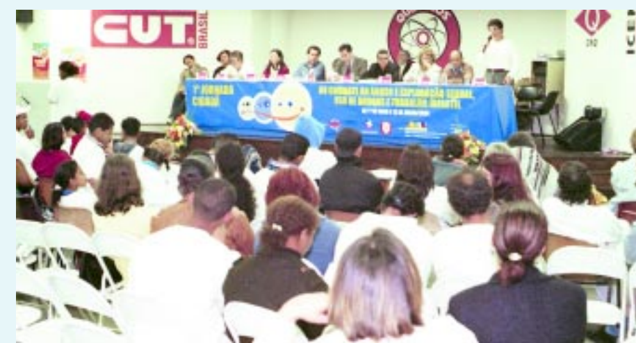
No ano passado, Jornada Cidadã foi aberta no Sindicato dos Químicos

A nova etapa da 2ª Jornada Cidadã será aberta às 16h de hoje, com uma caminhada organizada pelos sindicatos dos Químicos, Metalúrgicos e Bancários do ABC e de movimentos sociais que sairá do Paço Municipal de Santo André em direção à sede do Sindicato dos Químicos do ABC, na Avenida Lino Jardim, 401, em frente a Praça Kennedy.