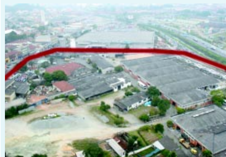
O futuro campus da universidade (na área demarcada) será em Santo André, em terreno de 70 mil metros quadrados

Cursos voltados à vocação industrial do ABC serão as prioridades da Universidade Federal do ABC, que terá seu projeto sancionado pelo governo neste mês.