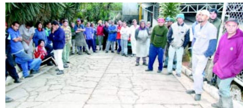
No alto, votação na Pirelli, e acima a assembléia com o pessoal na Dulong