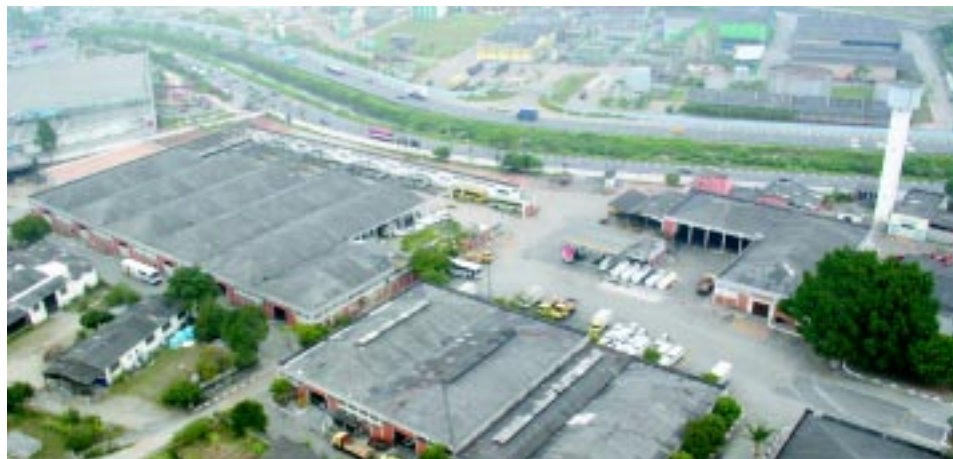
A UFABC será nas antigas instalações da Garagem Municipal de Santo André, na Av. do Estado

um exemplo de qualidade de ensino e a região passará a ser uma referência nacional", afirmou ele.