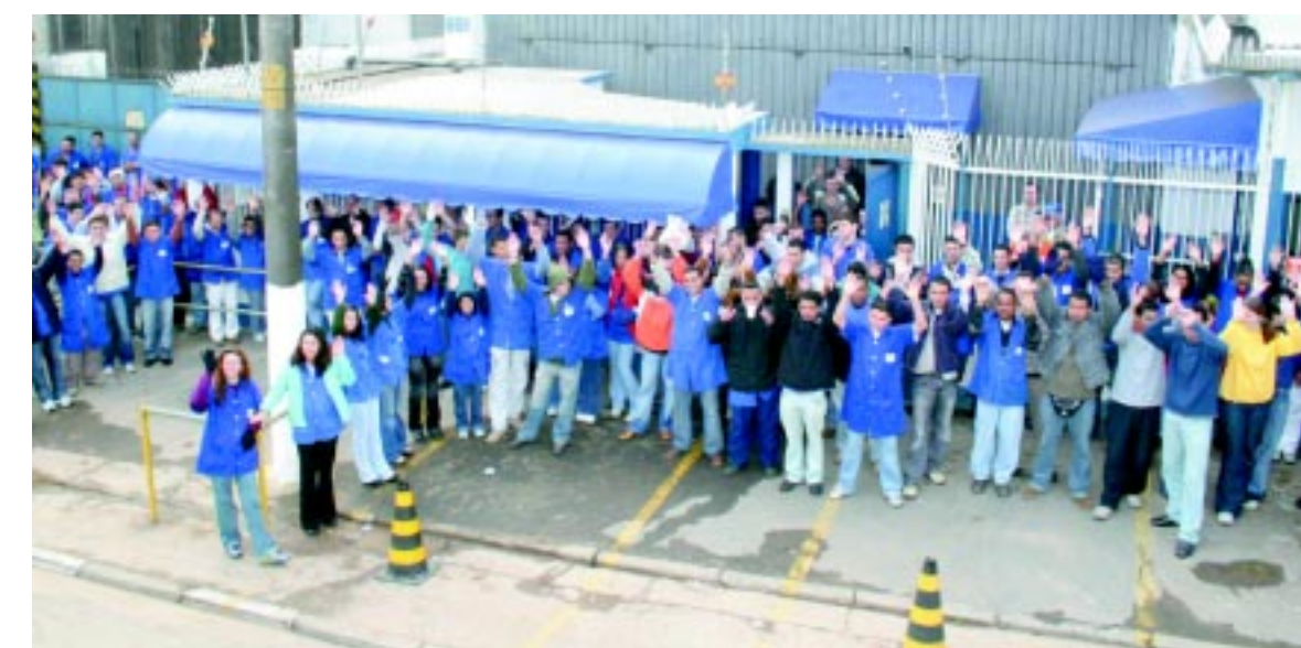
Companheirada na SMS aprovou ontem acordo de PLR

O Sindicato já assinou 110 acordos de PLR neste ano, que vão garantir R$ 203 milhões no bolso de aproximadamente 62 mil metalúrgicos do ABC. Ontem foram aprovadas propostas na Dulong, SMS e Pirelli.