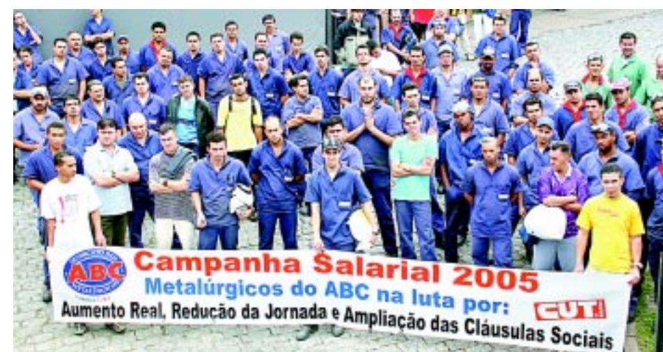
Assembléia de mobilização do pessoal na Metal 2, ontem à tarde