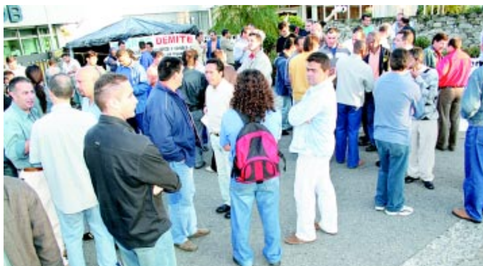
Ato ontem na B.Grob reuniu dezenas de trabalhadores de outras fábricas

Ele lembrou que o Sindicato vai continuar com essa linha de atuação e procurar a abertura do diálogo com a B.Grob. "Esta é a forma do Sindicato atuar", concluiu.