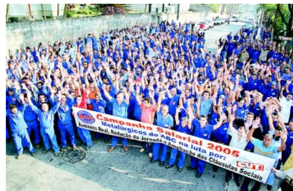
Ato ontem em Diadema reuniu trabalhadores na Delta, CHS, Delga e Brasmeck

Outra assembléia de mobilização aconteceu na Metal 2 de Santo André.