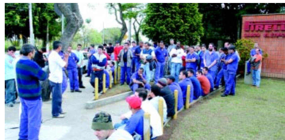
Trabalhadores na Pirelli participam de ato na empresa ontem à tarde

"Fazemos questão de chegar no mês de setembro com a campanha salarial resolvida para podermos retomar outra briga: a luta pela correção da tabela do Imposto de Renda", concluiu Feijóo.