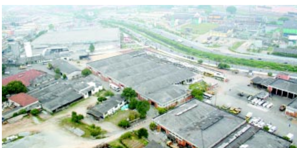
O terreno da futura universidade tem 70 mil metros quadrados

Finalmente, a Câmara de Santo André aprovou ontem o projeto do prefeito João Avamileno (PT) doando terreno na avenida do Estado para a construção da reitoria e do primeiro campus da Universidade Federal do ABC.