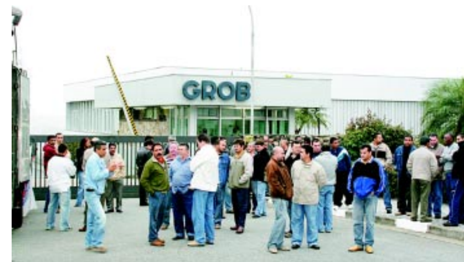
Paralisação em toda manhã afetou a produção da fábrica