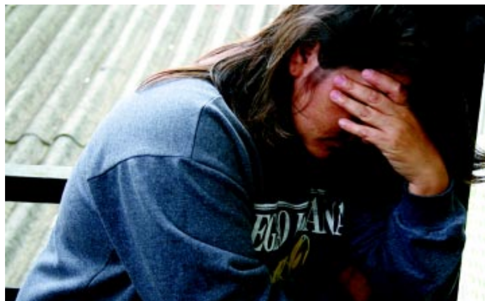
As mulheres estão perdendo o medo e denunciando seus agressores

Desde março, a Casa Beth Lobo, junto com a Assessoria de Promoção da Igualdade Racial, onde desenvolve trabalho na perí-