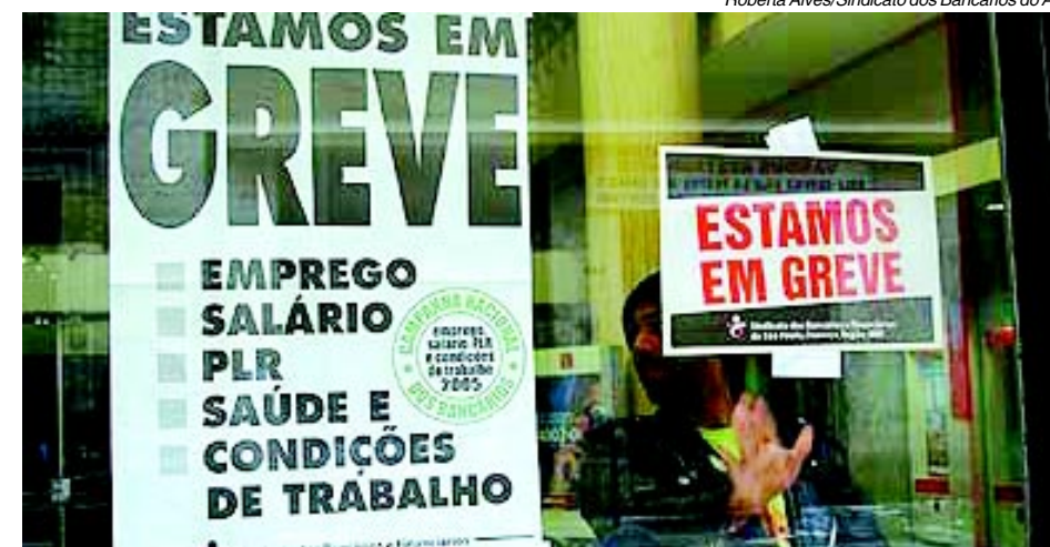
Agência do HSBC fechada ontem no Centro de Santo André

Os bancos ofereceram 4% de reajuste, abono de R$ 1.000,00 e PLR de 80% do salário mais R$ 733,00 fixos.