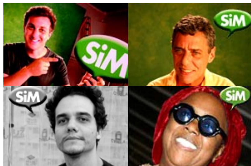
Luciano Huck, Chico Buarque, Wagner Moura e Sandra de Sá fazem campanha pelo sim

Começa neste sábado a propaganda gratuita para o referendo de 23 de outubro sobre a proibição do comércio de armas de fogo e munição no Brasil. Serão nove minutos diários no rádio e na televisão para cada uma das duas frentes parlamentares. São elas: Por um Brasil Sem Armas e Pelo Direito da Legítima Defesa.