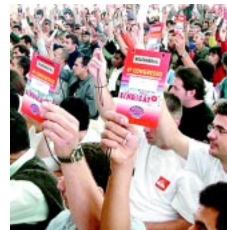
Categoria define rumo do Sindicato

Entre os dias 10 e 30 de outubro serão realizadas as reuniões de fábricas ou grupo de fábricas na