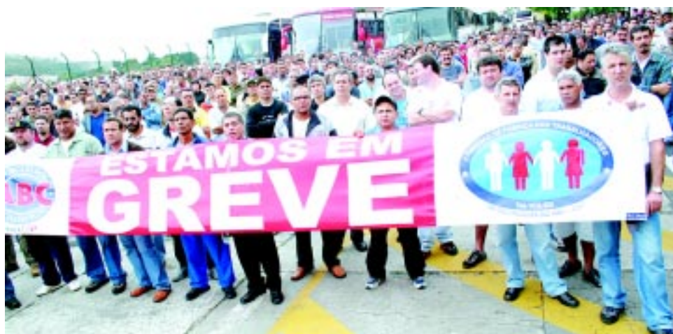
Com a nova proposta rejeitada, trabalhadores decidem continuar em greve

Assembleia realizada pelos trabalhadores na Volks na tarde de ontem decidiu continuar com a greve até a conquista de PLR decente.