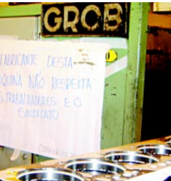
Centros de usinagem ficaram uma hora parados

Com protesto do pessoal na Usinagem, a chiadeira da Mercedes foi imediata porque parou a produção de bloco de motores para exportação aos Estados Unidos. A resposta da Comissão de Fábrica também foi imediata: