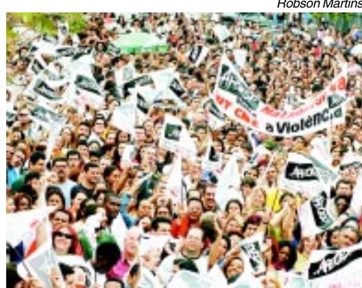
Protesto dos professores na Av. Paulista

Na prática, Alckmin poderia demitir os 120 mil professores no encerramento dos anos letivos, para fazer recontrações no ano seguinte,