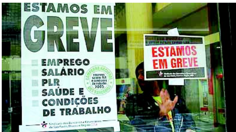
A greve nacional dos bancários cresceu no terceiro dia

O Metrô pretende aumentar a jornada de trabalho dos operadores de 36 horas para 40 horas semanais. Além disso, a companhia se