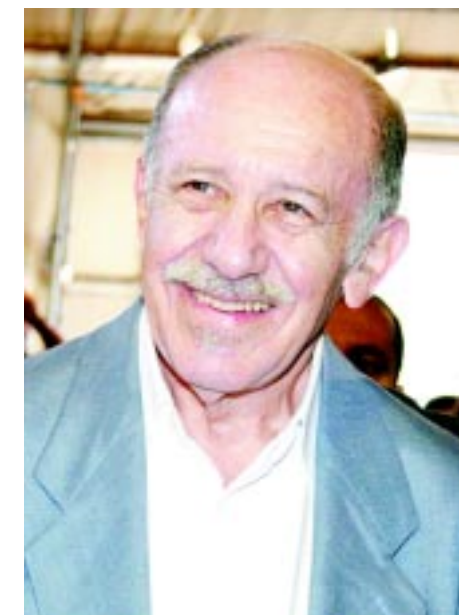
Singer amanhã na Sede do Sindicato

A cadeia do algodão orgânico compreende cooperativas de produ-