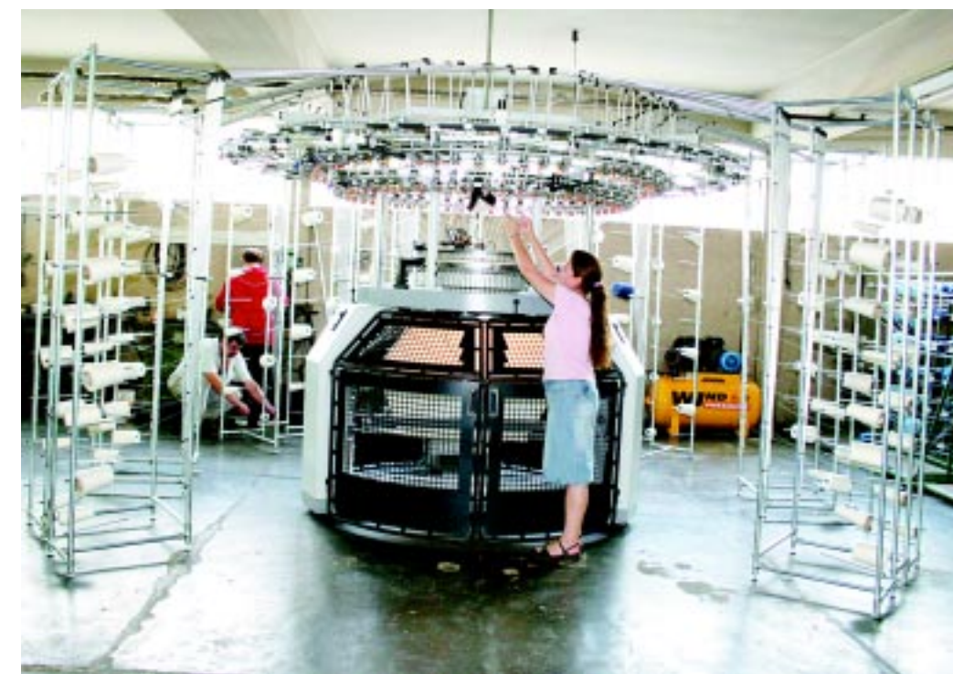
Com novo tear, Textilcooper passa a produzir malha e fecha a cadeia do algodão

O secretário nacional de Economia Solidária do governo federal, Paul Singer debate o tema amanhã, às 10h, na Sede. Ele abre o ciclo de encontros temáticos do 5º Congresso no momento em que cooperativas da Unisol fecham a cadeia do algodão orgânico. A participação é obrigatória para quem quer conhecer um outro tipo de economia. Página 3