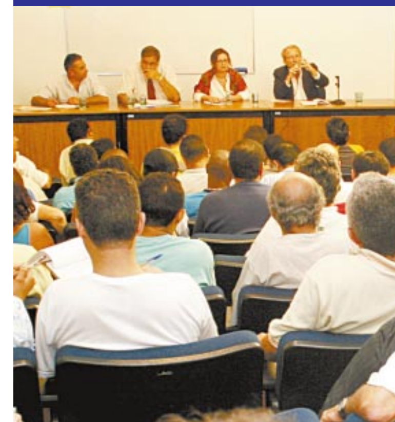
Acompanhe na página 3 o debate sobre a grande imprensa

Neste fim de semana, com as plenárias finais do 5º Congresso, os delegados eleitos vão votar dezenas de propostas apresentadas nas reuniões por empresas e nas temáticas. Com isso, nossa categoria define as novas diretrizes e ações que vão nortear o Sindicato nos próximos anos. Veja abaixo alguns dos temas que serão votados.