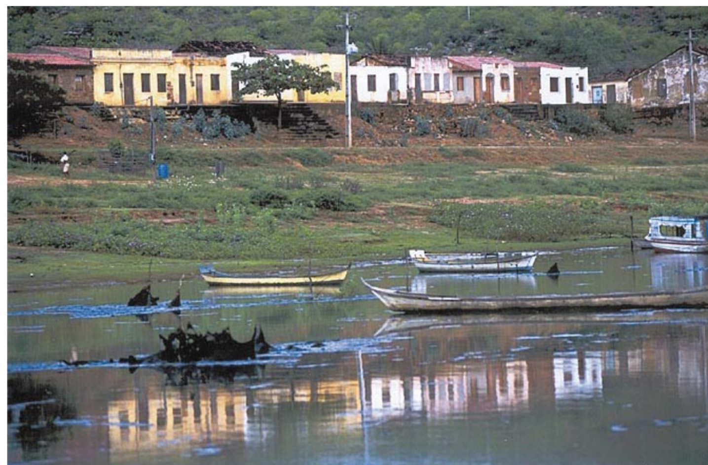
A transposição não irá afetar o curso natural do rio. Apenas 1% das suas águas serão utilizadas

Desenvolver e dinamizar a economia de uma região que há séculos sofre com a indústria da seca são os principais objetivos da transposição do Rio São Francisco. Conheça na página 3 detalhes do projeto que vai beneficiar 12 milhões de brasileiros.