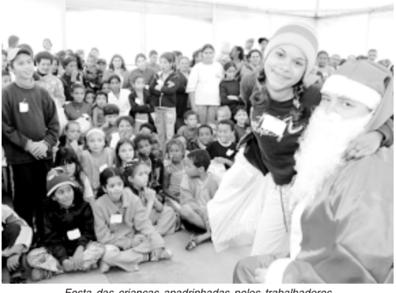
Festa das crianças apadrinhadas pelos trabalhadores

Em uma grande festa no Sesi Diadema, no último sábado, os grupos Super Amigos (formado por companheiros na Scania) e o Marcando Território (trabalhadores na Brasmetal) entregaram sacolas de Natal para 250 crianças carentes de Diadema.