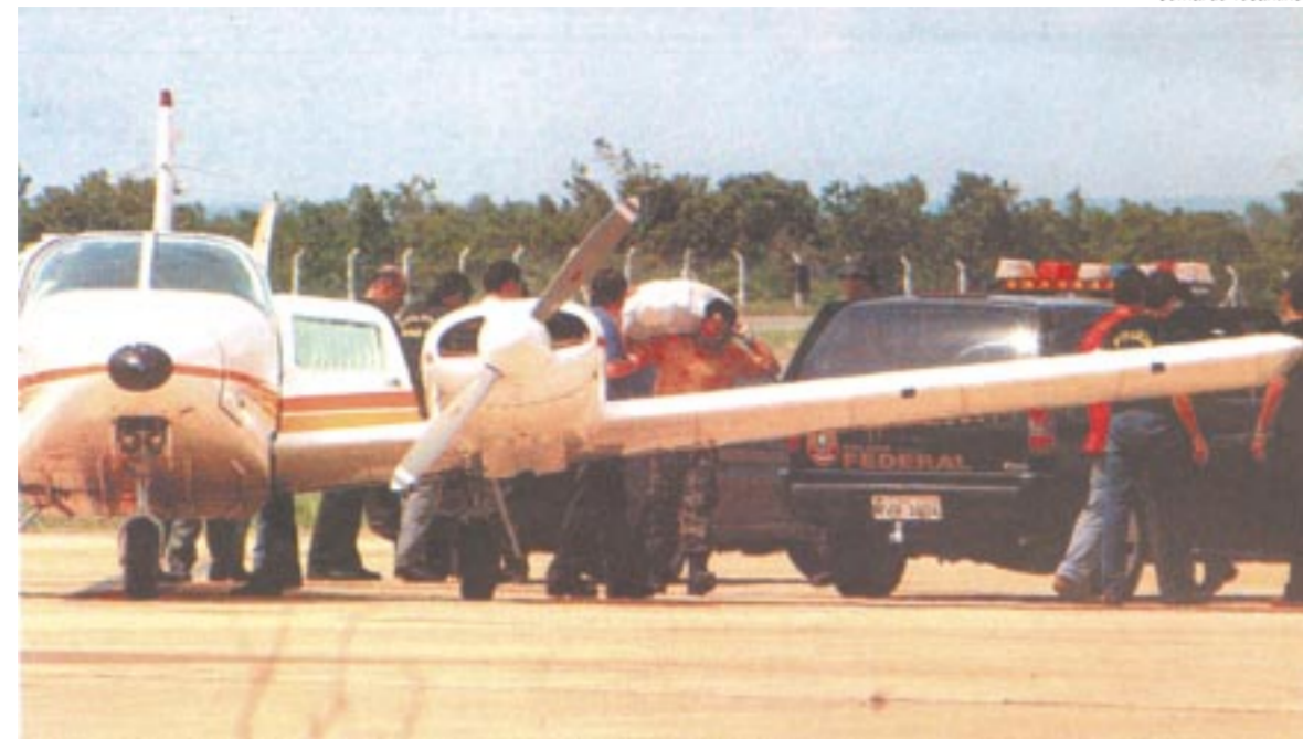
Apreensão do avião do tucano que levava R$ 60 milhões em cocaína