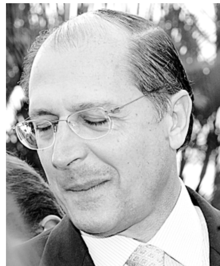
Beneficiado pelo Furnasduto, Alckmin tenta desqualificar a lista