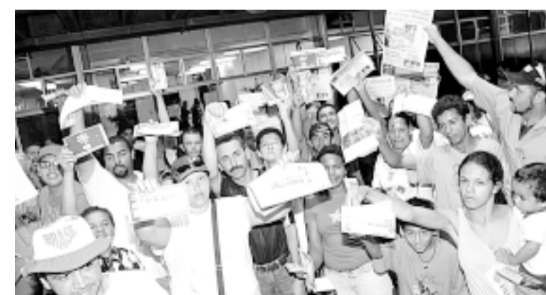
Moradores protestaram no Paço e não foram atendidos por Dib

No final de semana aconteceram dois protestos contra a Prefeitura reunindo centenas de pessoas, um no sábado no Parque dos Quí-