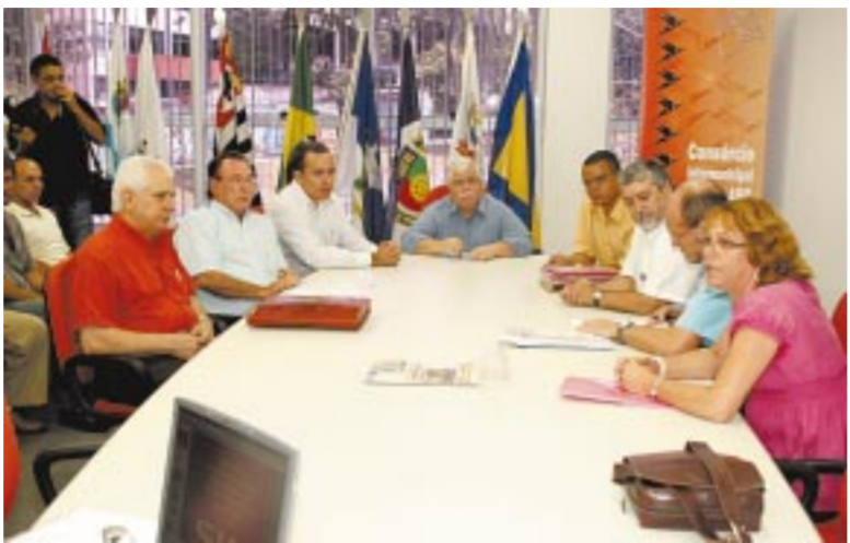
Os sindicalistas com os prefeitos da região

Um grupo de sindicatos da região, incluindo os metalúrgicos do ABC, entregou ontem aos sete prefeitos do ABC uma série de propostas dos trabalhadores para o fortalecimento econômico e social da região.