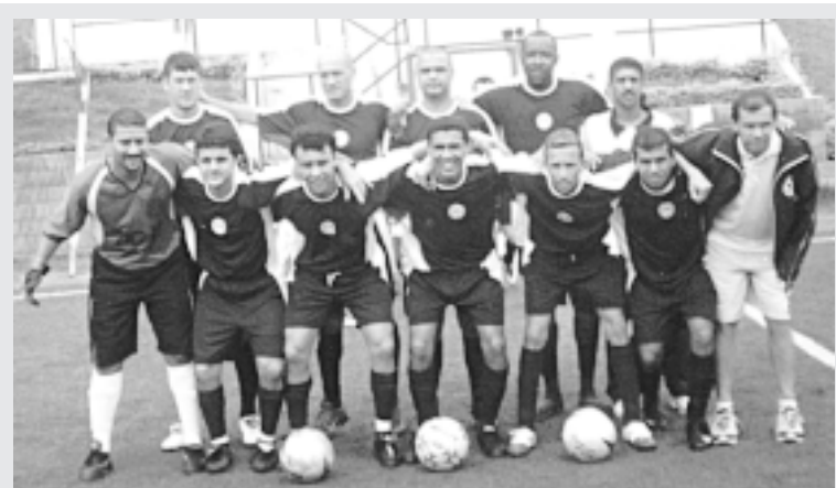
O Volks Futsal, campeão do Torneio do Sesi, participará do nosso campeonato

Cada autor escolhe se quer apresentar um desenho ou uma redação e os melhores serão premiados com computadores.