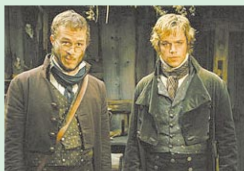
Cena do filme sobre os Irmãos Grimm

Orgulhoso, o coelho propõe uma corrida à tartaruga para levar vantagem, mas acaba caindo numa armadilha. Domingo às 16h. Ingressos entre R$ 10,00 e R$ 5,00.