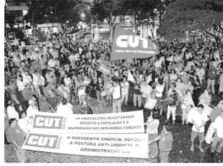
Servidores querem acordo coletivo salarial e valorização do serviço público

No total são 90 alunos com aulas aos sábados das 8h às 19h40. Os interessados devem entrar em contato com Heloisa pelo 9858-4850. Ou ligar aos sábados para o fone 4066-6468.