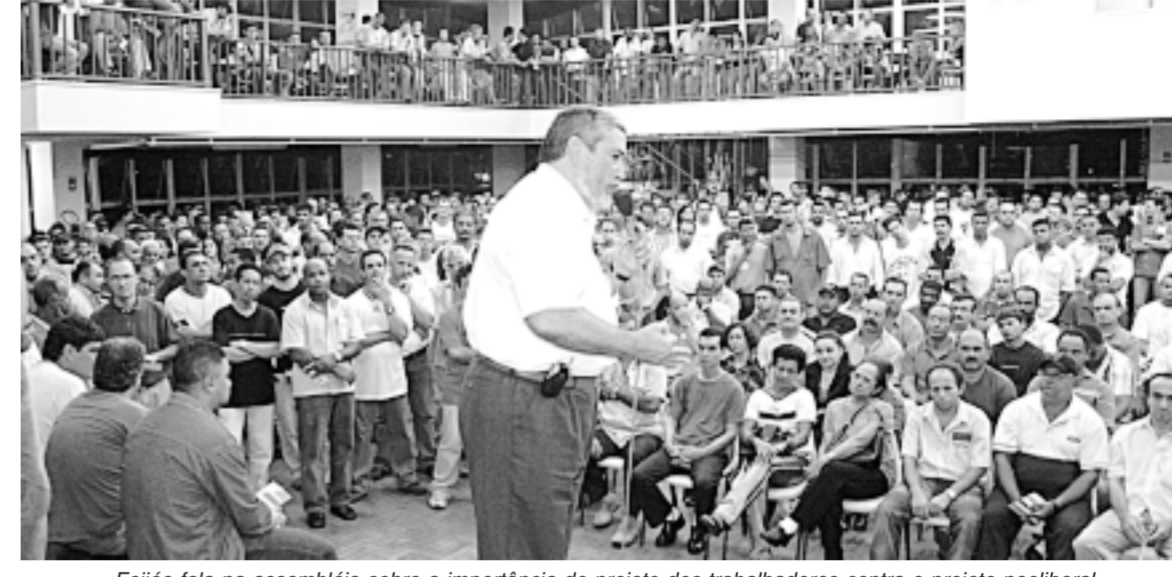
Feijóo fala na assembléia sobre a importância do projeto dos trabalhadores contra o projeto neoliberal

A conquista pelo Brasil da auto-suficiência em petróleo é o destaque do Repercut e amanhã. Outra reportagem mostra os trabalhadores que dependem da bicicleta como meio de transporte. O Repercut é transmitido aos sábados, às 22h, na Bandeirantes, canal 13, e domingos, às 11h, na Rede TV, canal 9.