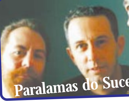
Paralamas do Sucesso