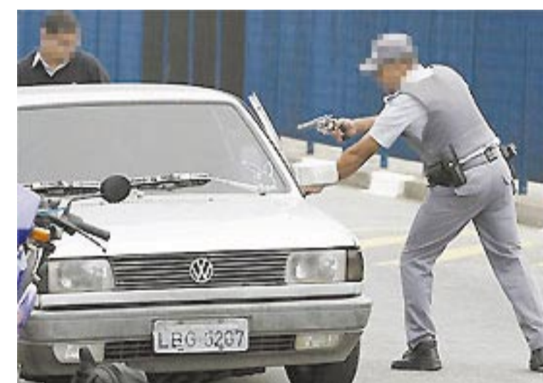
PM aborda suspeito durante blitz

Desde sexta-feira à noite 93 pessoas consideradas suspeitas foram mortas em São Paulo. O aumento do número de chacinas praticadas por assassinos de blusa preta e capuz ninja, além de mais suspeitos mortos pela PM, levam pânico aos bairros mais pobres da periferia. Página 2