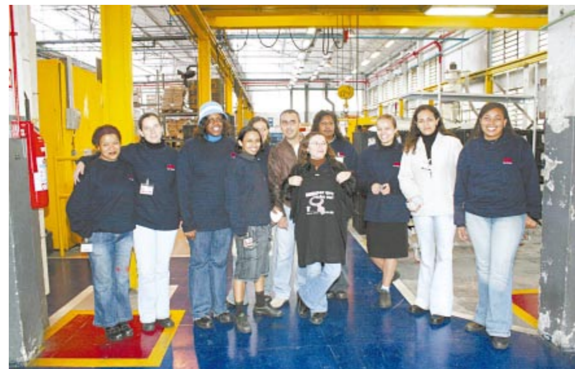
Representantes das comissões de mulheres e de sindicalização com as companheiras da Fiann

Segundo ela, é necessário ampliar a base de mulheres para que a luta por reivindicações específicas ganhem mais força. “Se a gente fortalecer nossa base feminina, for-