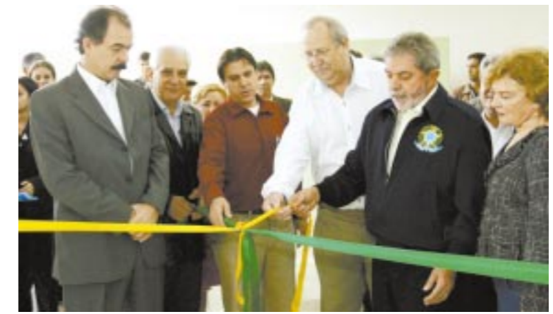
Inauguração do Consórcio da Juventude, que reúne 2.000 jovens no ABC

"A gente gasta quando tem que construir uma cela numa prisão; educação é investimento porque é profissão, é sabedoria, é inteligência. E cada jovem que a gente formar, depois de quatro anos ele retribuirá, quem sabe em pouco tempo, quatro ou cinco vezes o que foi investido para a sua