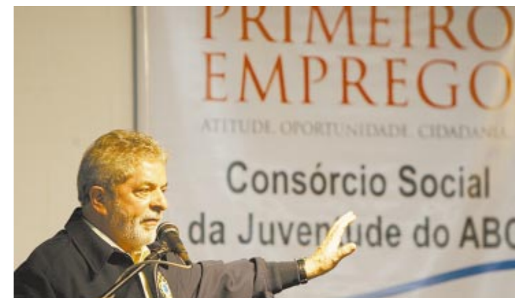
O presidente Lula na inauguração do programa sábado, em Santo André

Serão qualificados dois mil jovens até o final do ano. Para o presidente Lula, que inaugurou o programa sábado, os recursos para educação não são considerados gastos, mas sim investimentos.