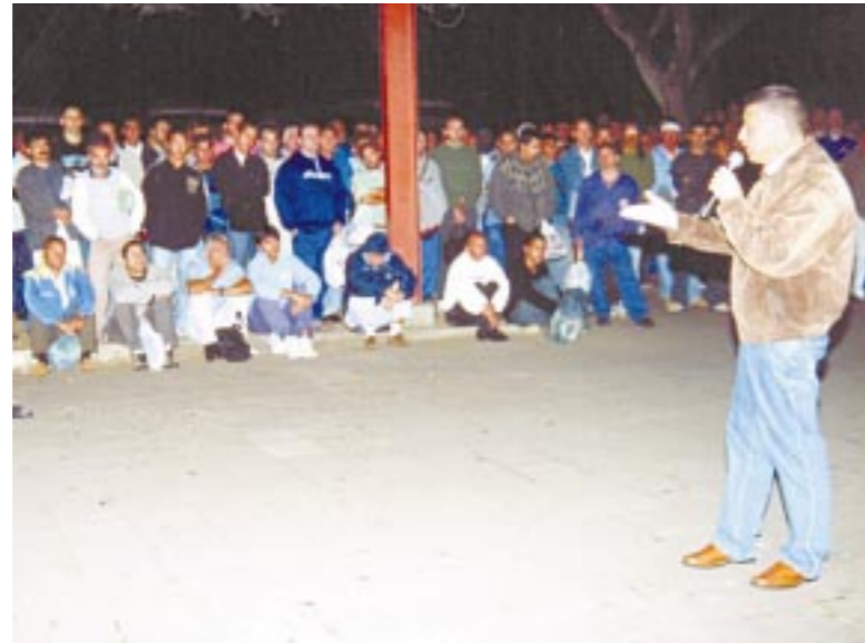
Biro Biro: Volks persegue o movimento sindical