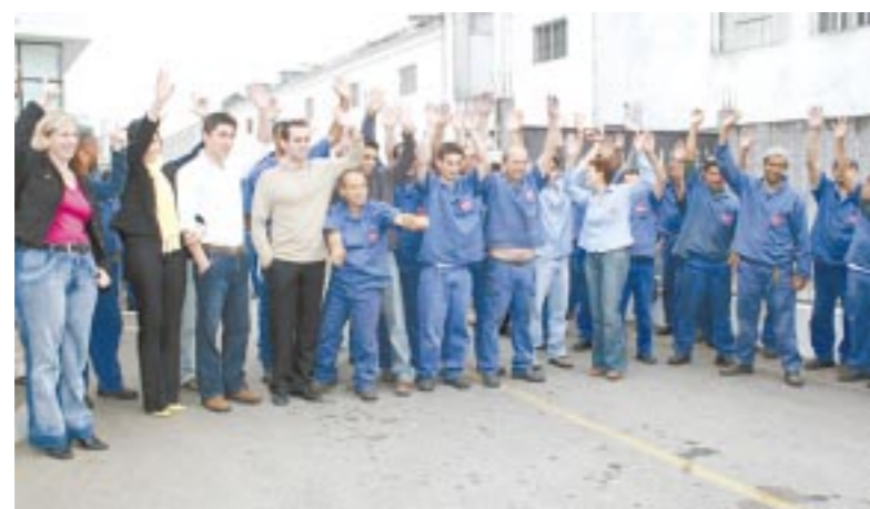
Proposta é aprovada por unanimidade na Mark Grundfos

Em assembléia realizada ontem pela manhã, os trabalhadores na Mark Grundfos, em São Bernardo, aprovaram por unanimidade a proposta de PLR negociada pelo Sindicato, CSE e empresa, que garante aumento no valor de pagamento. A primeira parcela será paga no próximo dia 30 e a parcela final em 31 de janeiro.