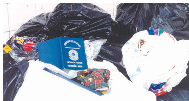
Ameaça agora atinge companheiros nas micro, pequenas e médias empresas

Batizada de Simples Trabalhista, a proposta é baseada em estudos do sociólogo José Pastore, assessor da Fiesp e de Alckmin na campanha presidencial. É de Pastore a idéia de eliminação do artigo 618 da CLT tentada no governo FHC.