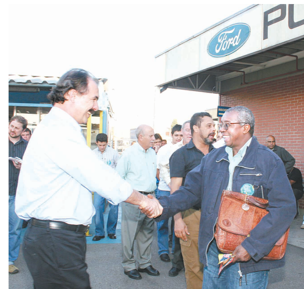
O senador Mercadante esteve ontem cumprimentando os trabalhadores na Ford pelos 25 anos da Comissão de Fábrica e participará da assembleia sábado

A luta por melhores salários dos companheiros e companheiras que trabalham nas fábricas dos grupos 9 e 10 começa neste sábado com assembleia de organização da campanha salarial.