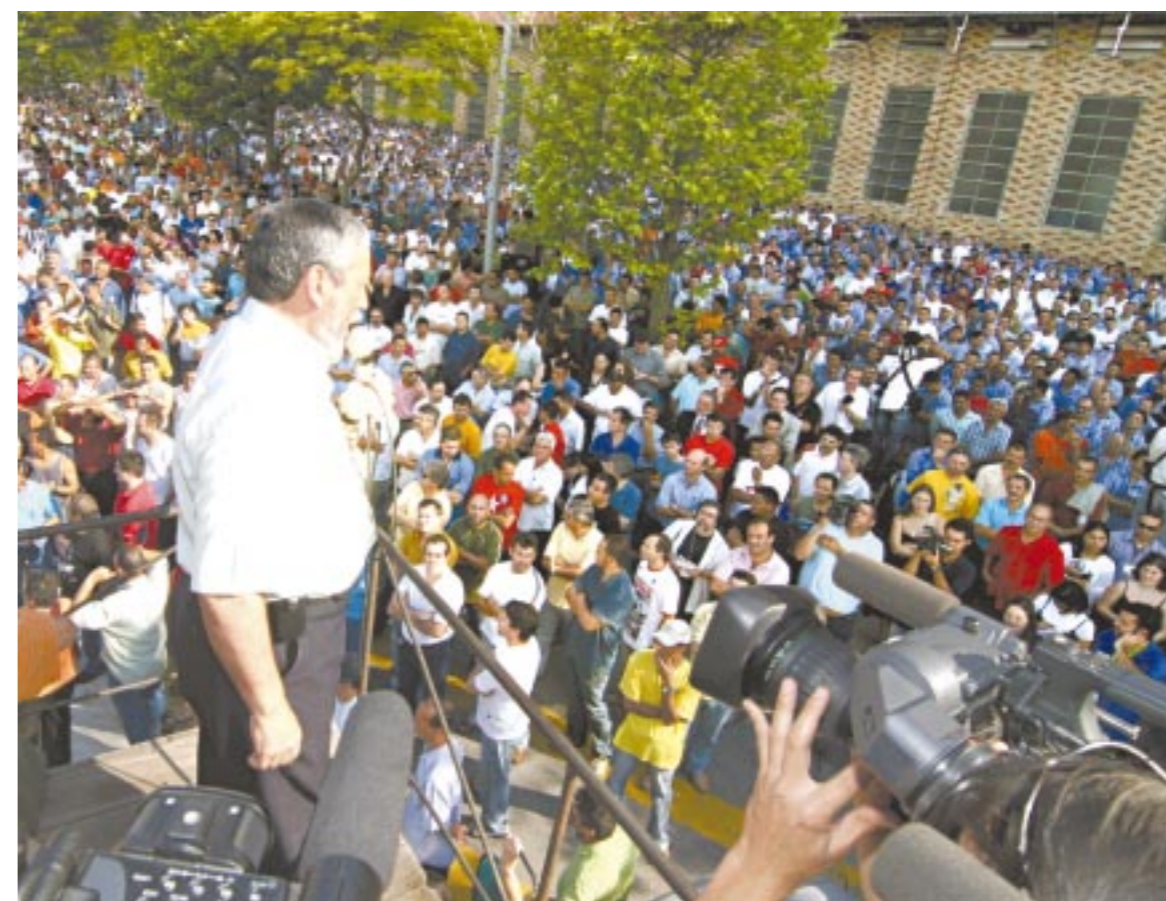
Feijóo afirmou na assembleia que negociações garantiram direitos e impediram a Volks de demitir como ela queria

O Departamento Jurídico do Sindicato está à disposição desses companheiros