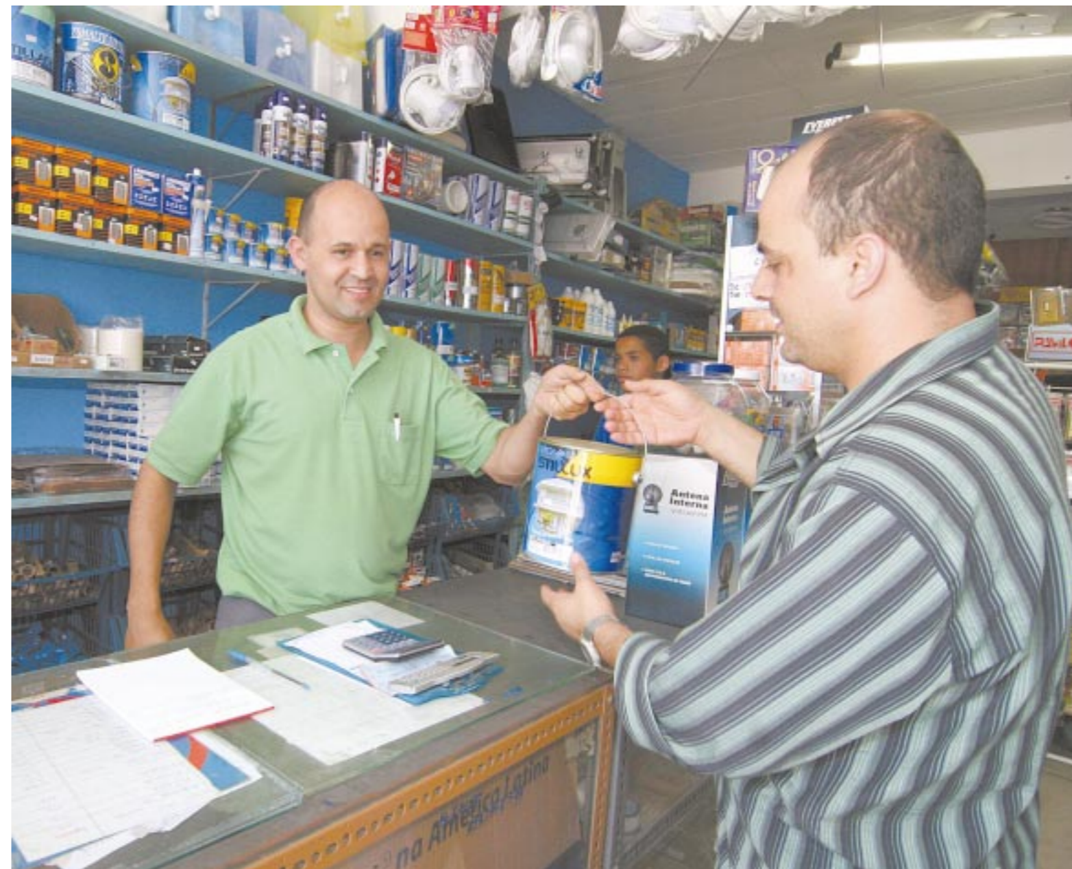
Comércio foi o setor responsável pela criação do maior número de vagas no mês de outubro

Dois dos principais indicadores de emprego, o Caged e a pesquisa IBGE, mostram que a abertura de vagas com registro em carteira segue em expansão no País. A renda do trabalhador também cresceu. Página 3