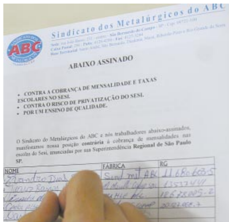
As listas contra a cobrança irregular circulam até dia 28

A entidade anunciou que quer cobrar até R$ 2.500,00 anuais a partir do ano que vem. A medida desencadeou protestos de pais e dos sindicatos que consideram a cobrança injusta pois as empresas embutem no preço dos produtos a contribuição que repassam ao Sesi. As listas irão circular até dia 28. Cópias do abaixo-assinado podem ser retiradas na Secretária-Geral, na Sede.