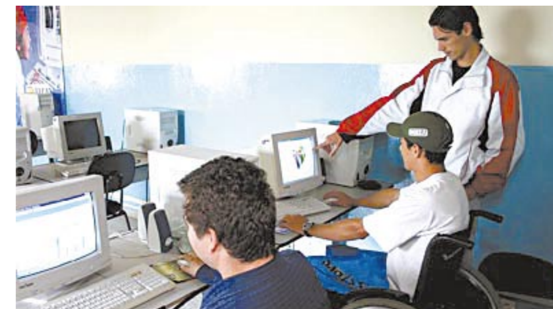
Programas do governo federal promovem inclusão social e elevam renda

O Brasil passou a ser definido como exemplo no combate à desigualdade social por causa do desempenho econômico dos últimos anos, aliado às políticas de distribuição de renda. A análise vem de relatório da ONU.