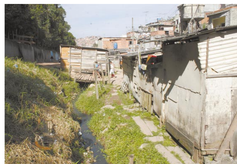
A pobreza é uma das maiores violações aos direitos humanos

seu pensamento sobre direitos humanos. “É a defesa da vida. Iguais na diferença. Que bom que temos cores diferentes, opiniões diferentes e opções diferentes, porque são nessas diferenças que