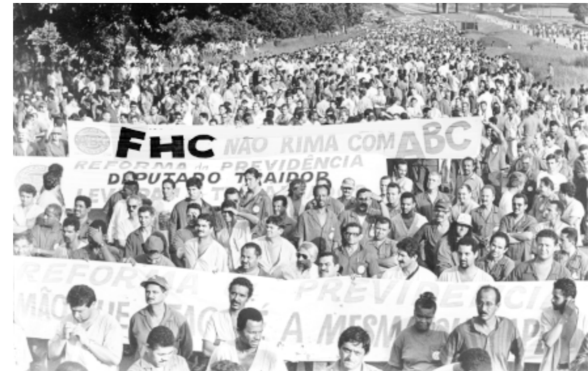
FHC não rima com ABC. Esta foi a palavra de ordem de protesto dos metalúrgicos quando o ex-presidente esteve na região em 98

Em outubro passado, vésperas do governo Lula completar quatro anos, a quantidade de trabalhadores empregada na região tinha aumentado para 657 mil, um crescimento de 19% em relação a FHC.