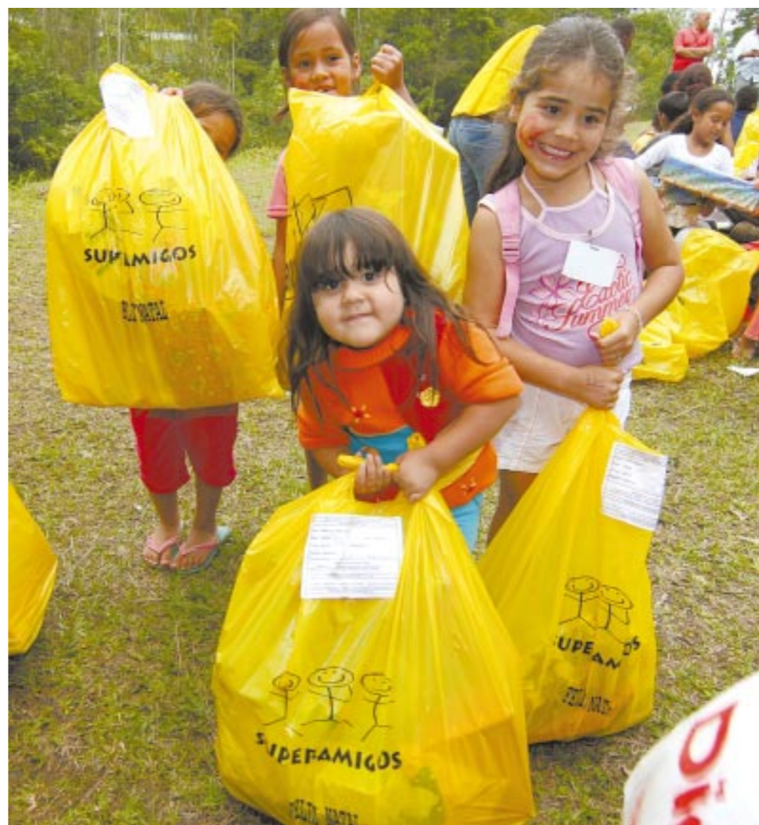
Crianças apadrinhadas por metalúrgicos mostram suas sacolas de presentes

Metalúrgicos de empresas da base vão à luta para arrecadar alimentos, presentes, oferecer carinho, atenção e proporcionar um fim de ano melhor para aqueles que pouco ou quase nada possuem. Página 3