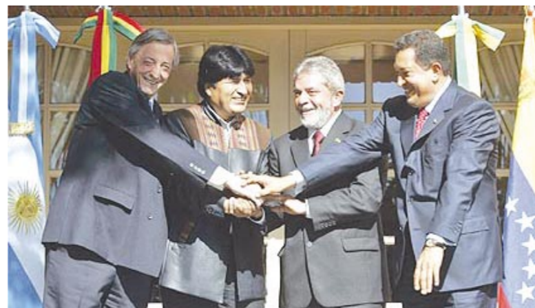
Kirchner, Evo Morales, Lula e Hugo Chávez querem a união do continente

Com a guinada à esquerda, ganham força propostas como integração regional, política externa independente, Mercosul ampliado com os demais países do continente, fim da dominação dos Estados Unidos, ampliação da democracia para toda a po-