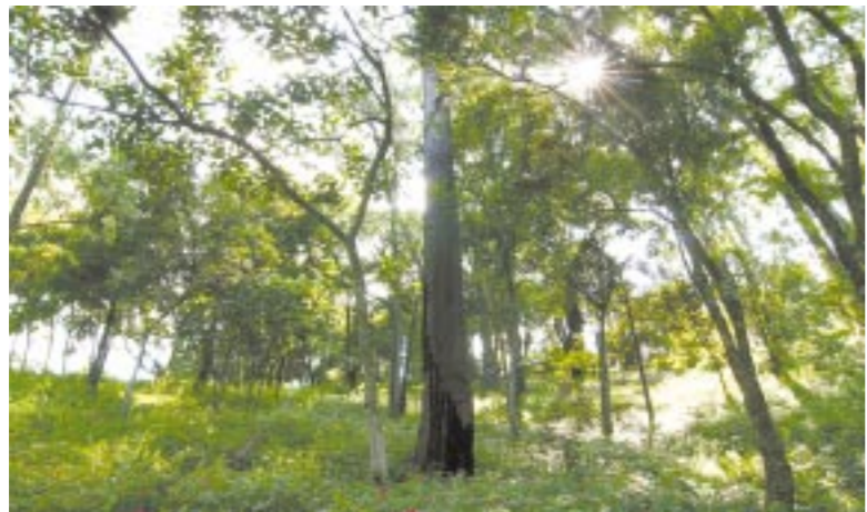
Entidades querem suspensão definitiva do corte de 341 árvores