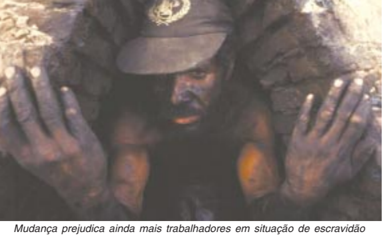
Mudança prejudica ainda mais trabalhadores em situação de escravidão