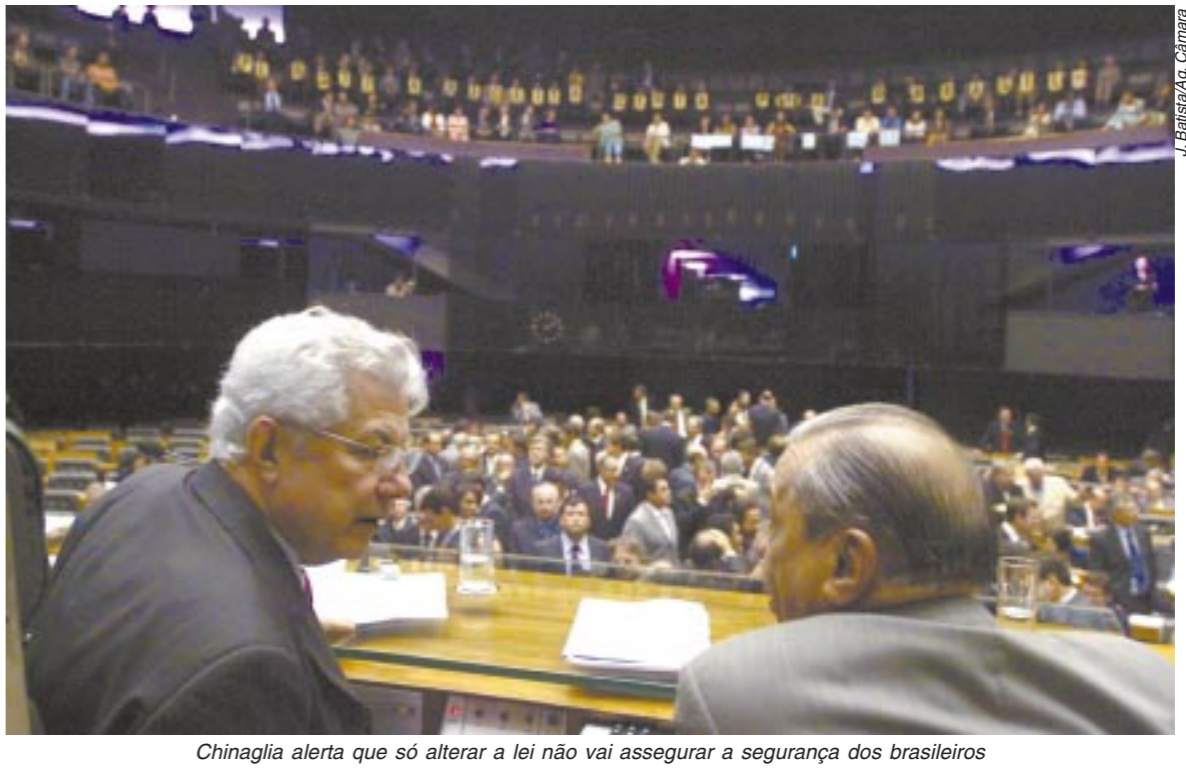
Chinaglia alerta que só alterar a lei não vai assegurar a segurança dos brasileiros

O presidente da Câmara, deputado Arlindo Chinaglia (PT), disse que é preciso tomar cuidado para não cair na ilusão de que mudar a lei vai garantir a segurança.