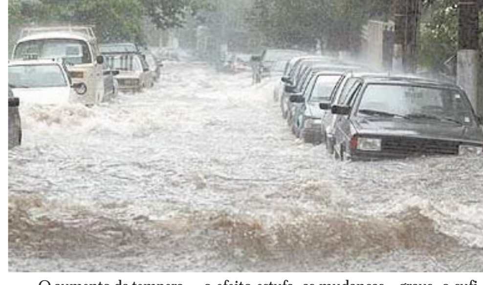
As enchentes se tornarão cada vez mais frequentes

Os desertos vão aumentar. Até 2025, dois bilhões de pessoas enfrentarão a falta de água. Em cem anos é possível que metade das espécies vivas estejam extintas.