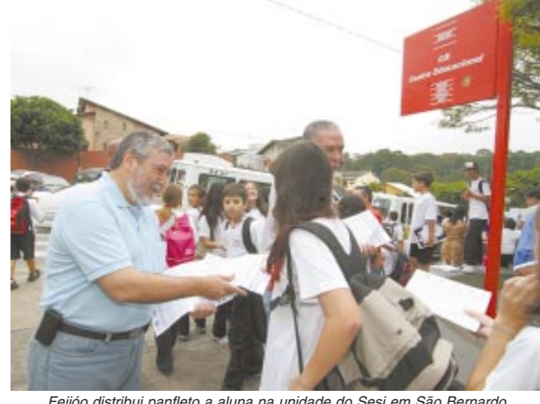
Feijão distribui panfleto a aluna na unidade do Sesi em São Bernardo

“Estamos estudando algumas possibilidades no campo jurídico e no político. A reunião de sábado vai debater as alternativas”, revelou o secretário-geral do Sindicato,