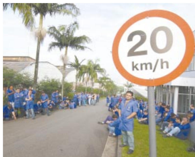
Assembléia dos trabalhadores na B. Grob na sexta-feira

Trabalhadores na B.Grob cruzaram os braços pela segunda parcela da PLR.