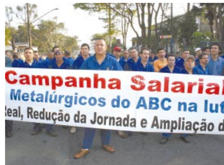
Campanhas salariais devem apontar para o Contrato Coletivo Nacional

"Usaremos o estudo como base na campanha salarial unificada que os meta-