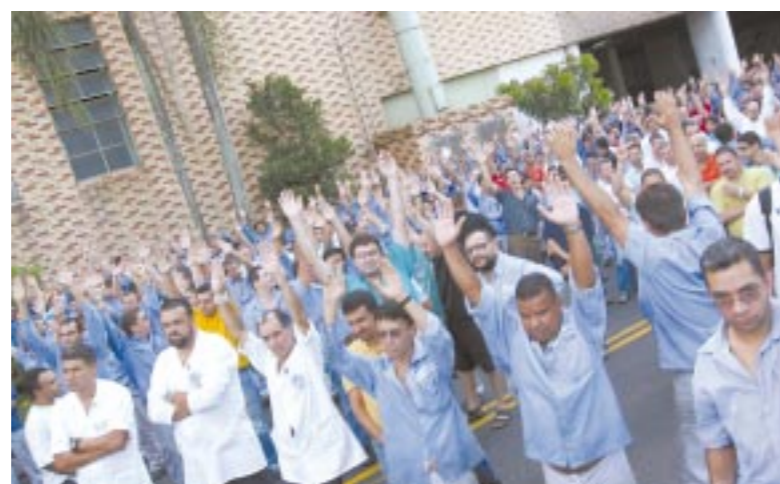
Trabalhadores na Volks não aceitaram mudanças no banco de horas

A administração do banco consta do acordo de reestruturação da fábrica, mas apresenta alguns problemas, inclusive na unidade de Tau-