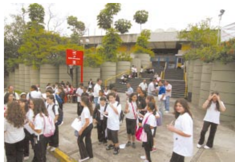
Para o Ministério Público, a denúncia contra o Sesi é procedente

sobre a ação, o MPF, por entender que não existe envolvimento das esferas federais nesse caso específico do