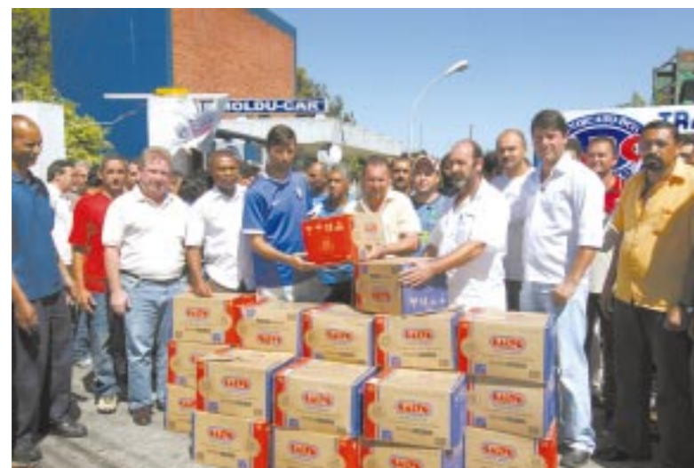
Companheiros na Scania contribuíram com R$ 2.393,00

As provas de solidariedade dos metalúrgicos do ABC com a luta dos companheiros na Fris Moldu Car bateram todos os recordes ontem. Em apenas um dia, foram entregues mais de sete mil reais em dinheiro e 910 quilos em alimentos aos trabalhadores na fábrica de autopeças em São Bernardo.