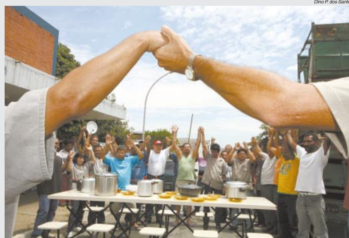
Almoço coletivo mantém mobilização dos trabalhadores em greve na Fris Moldu Car. Página 2