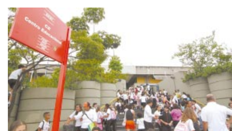
Sindicato quer conhecer opinião dos pais sobre a educação no Sesi

"Queremos que todos os pais respondam a pesquisa. Ela vai indicar as próximas