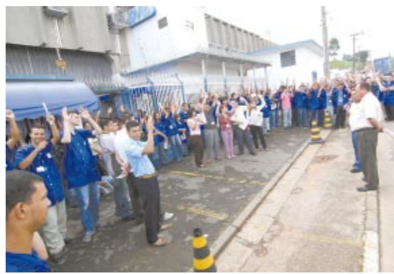
Novo plano garante realização de seleção interna para ocupar vagas abertas

O plano de cargos e salários na SMS é revisto e re-