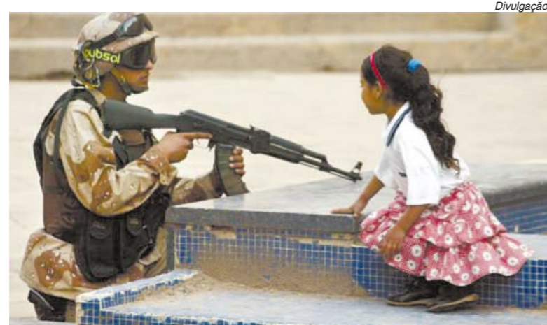
Conflito está sendo marcado pelo massacre da população civil

Com sua habitual prepotência imperialista, os norte-americanos acreditavam que a conquista do Iraque, um país pobre e atrasado, se-