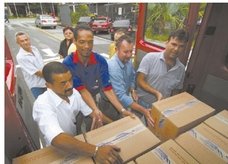
Solidariedade do pessoal na Premier reforça greve na Fris

Ele informou que prossegue o acampamento montado em frente a Fris por cerca de 50 companheiros, tam-