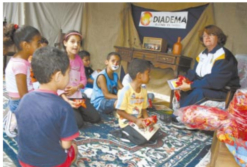
Projeto Adolescente Aprendiz (ao alto) e Conferência de combate à violência são dois exemplos de ações integradas promovidas em Diadema contra a violência

Marcada como cidade do crime e da morte, Diadema virou o jogo e hoje é referência nacional e internacional em segurança. Ações integradas da prefeitura na cidade reduziram todos os índices de criminalidade, especialmente os homicídios, que caíram 68% nos últimos oito anos. Página 3