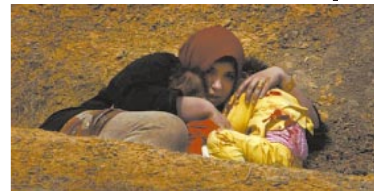
Mãe protege filhos durante bombardeio de americanos

Completo ontem quatro anos que os Estados Unidos iniciaram a Guerra no Iraque para tentar controlar as imensas reservas de petróleo existentes na região. Página 4