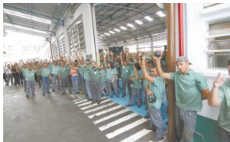
Assembleia dos trabalhadores na Ática aprova acordo

A primeira parcela será acertada em 27 de agosto e a segunda em 31 de janeiro do próximo ano.