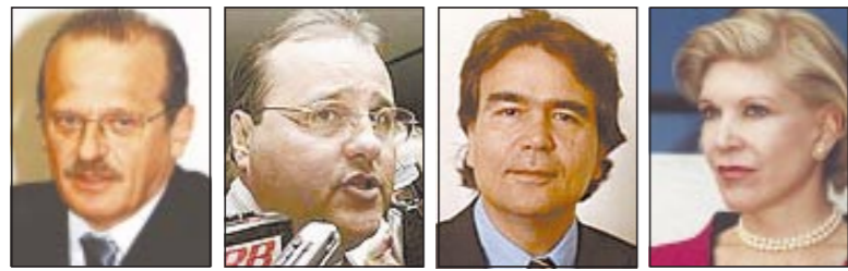
Tarso Genro Geddel V. Lima José G. Temporão Marta Suplicy

Com tranquilidade e sem aceitar pressões da mídia por definições rápidas, o presidente Lula está aos poucos anunciando o Ministério de seu segundo mandato.