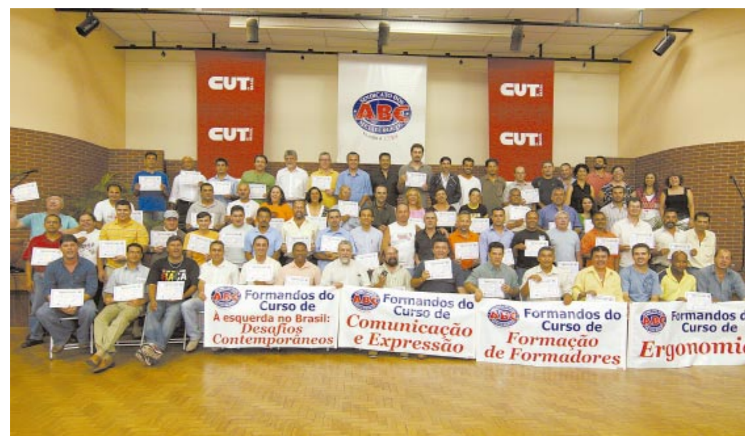
Parte dos alunos dos cursos do ano passado mostram certificados recebidos em cerimônia de formatura na última terça-feira

O Sindicato coloca sete cursos e seminários à disposição da categoria. Ao todo serão mais de 300 companheiros participando. O objetivo é capacitar trabalhadores para atuar no chão de fábrica ou na definição de políticas públicas. Veja os cursos e como participar na página 3.