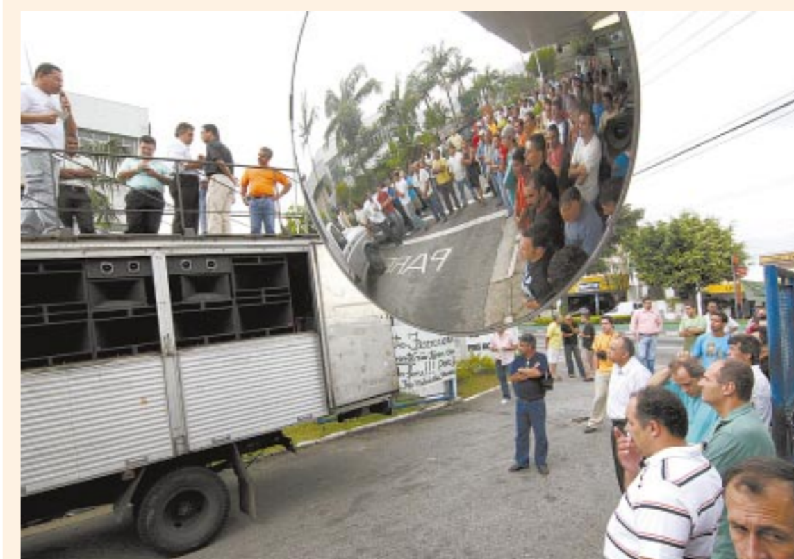
Ato dos trabalhadores na Fris ontem pela manhã

Há duas semanas em greve e há dois meses sem salário, os companheiros e companheiras na Fris Moldu Car enfrentam uma situação desesperadora. Eles continuam parados dentro da fábrica para impedir que o patrão leve o patrimônio. O Sindicato lançou campanha na categoria para manter movimento. Página 2