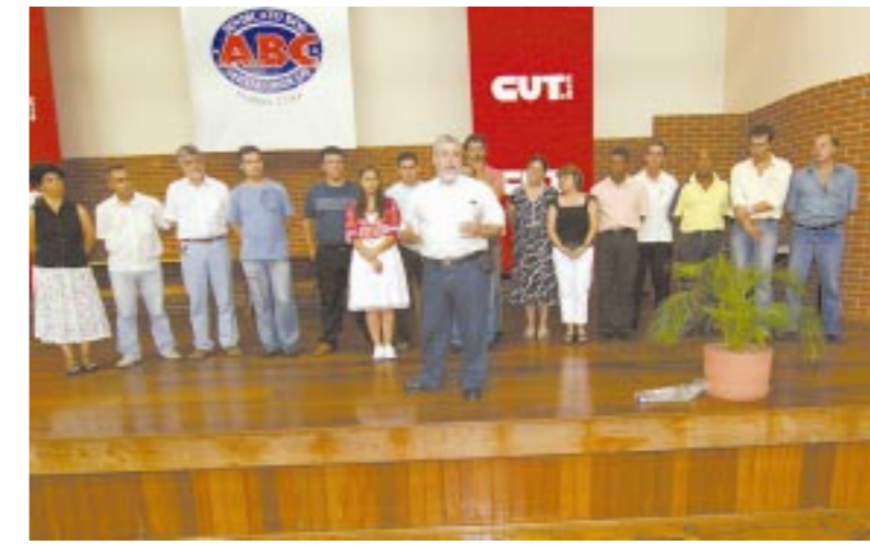
Feijão, formadores voluntários e o pessoal do Departamento de Formação

As inscrições serão feitas na fábrica, através da representação sindical. Procure a Comissão de Fábrica ou o CSE para obter mais informações sobre os cursos e os critérios de inscrição.