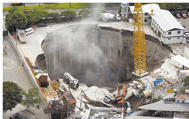
Presidente da Assembléia de São Paulo se nega a abrir a CPI do Metrô