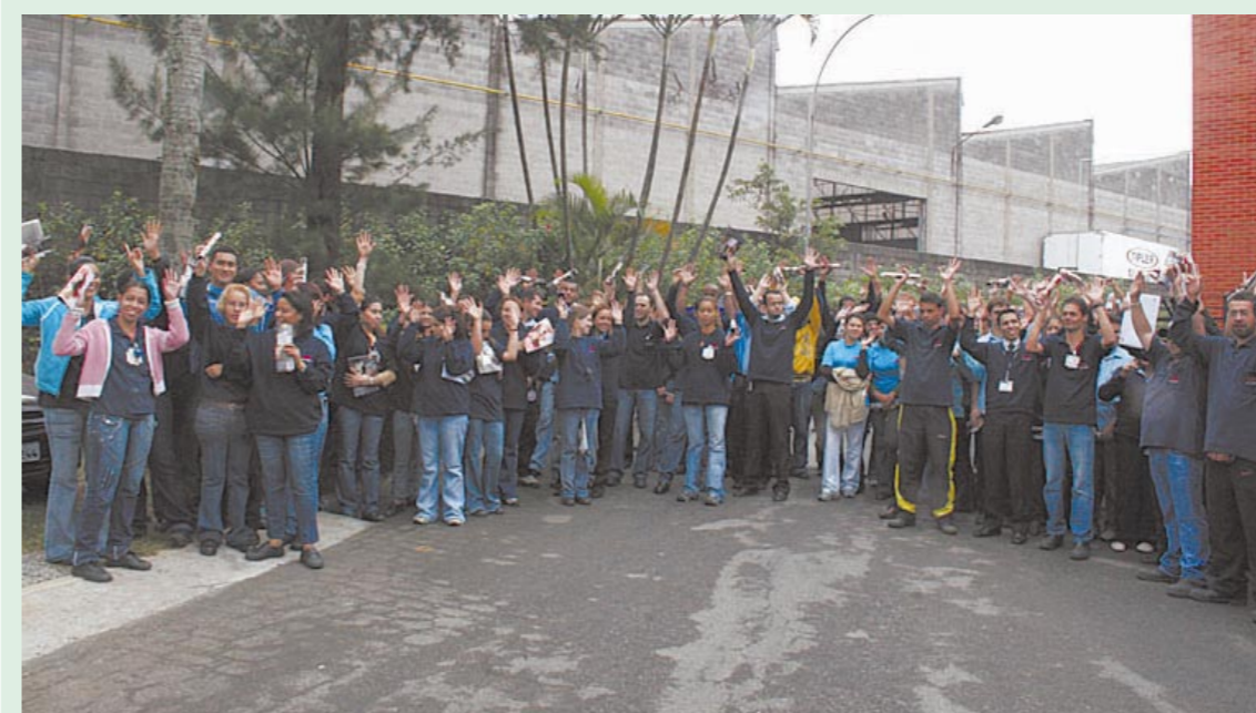
Assembléia na Fiamm aprovou proposta ontem. Página 3