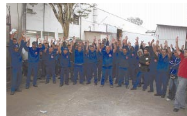
Após rejeitar proposta inicial, pessoal na CHS aprovou a PLR ontem

A mobilização do pessoal tem resultado em conquistas. Nas próximas sema-